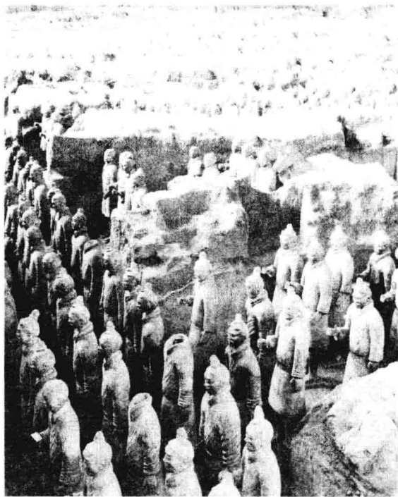
壮观的秦始皇兵马俑，其巨大的规模、威武的场面和高超的科学、艺术水平，让今人惊叹不已。

后，在李斯的建议下，秦始皇就在全国推行“焚书令”与挟书律，“焚书令”规定：“非博士官所职，天下敢有藏《诗》、《书》、百家语者，悉诣守、尉杂烧之。有敢偶语《诗》、《书》者弃市。以古非今者族。”此令出后，全国开始了大规模的焚书运动。秦都城咸阳收起的书堆积如山，熊熊烈火烧了几十天。有许多珍贵的书籍、史料都因这次焚书而永远地失传了。幸亏孔子的后代冒着杀头的危险，将一部分儒家经典藏入孔府的墙壁中，古籍总算保存了一部分，这部分古籍成了汉代古文经学派的理论依据，因而引发了长期的今古文经学之争。