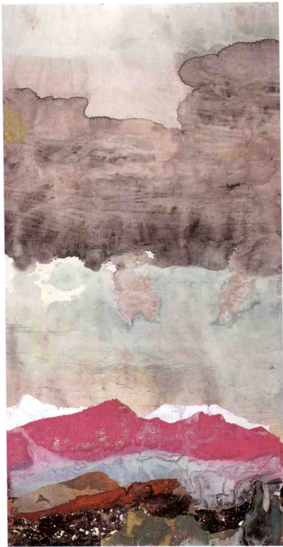
◇ 天 恋