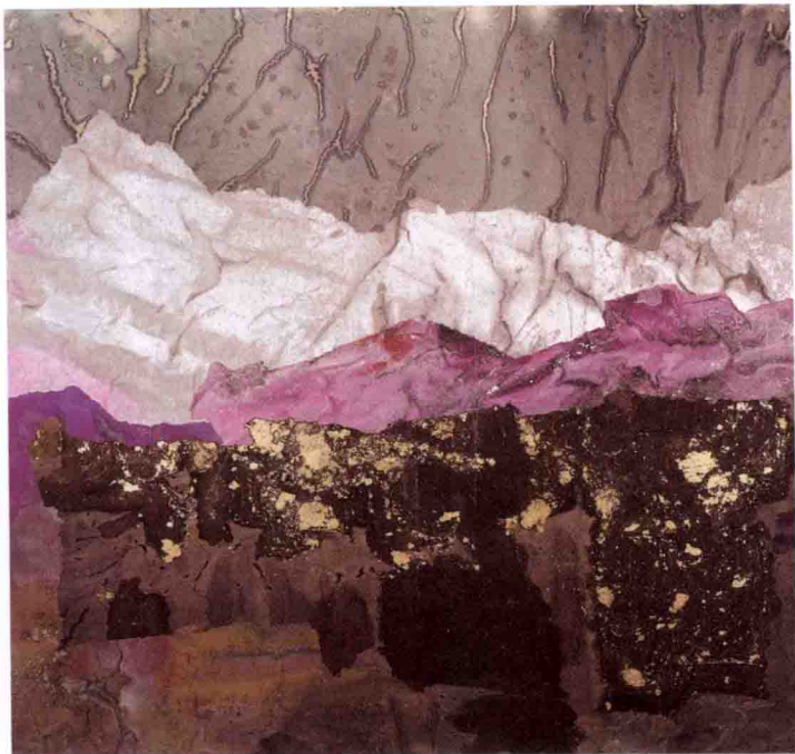
◇ 夕山初雪 68×68cm， 2006年， 纸本 综合材料

然而这样的艺术社会观却是以牺牲完整的艺术观为代价的，而且丝毫触动或者影响不了西方当代真正的前沿性艺术。因为以艺术的方式去寻求社会政治制度的自由和民主，过去和现在都不是西方艺术的主流，对整个人类生存境遇的自然与环境意识的表现才是今天西方艺术真正的关注重点。就西方民主、自由和公民意识的培养而言，几百年前开始的启蒙运动和工业革命，才是思想上和技术上的关键因素，而西方艺术却因为要克服工业化带来的弊端和挑战，便转而在风景画和绘画语言本体进行了长时间的探索。