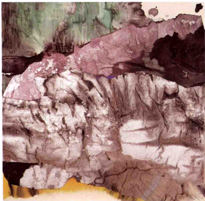
◇ 隐 雪 67×67cm， 2010年， 纸本 综合材料

艺术的确是因人而生的，艺术为人的社会观的确是艺术首要和根本的目的，但这并不意味着艺术的视觉表现对象和题材必须完全充斥着人及其组成的社会，尤其是中国这个似乎特殊的社会国度。人的社会不仅是人组成的，还是自然环境组成的，没有了自然环境的人及其社会是难以想象和根本不存在的。这一基本的道理在这三十多年中国艺术的发展中却被整体忽略甚至遗忘了，而这个注重人与自然关系的道理却是我们的祖先在艺术上给世界视觉宝库提供