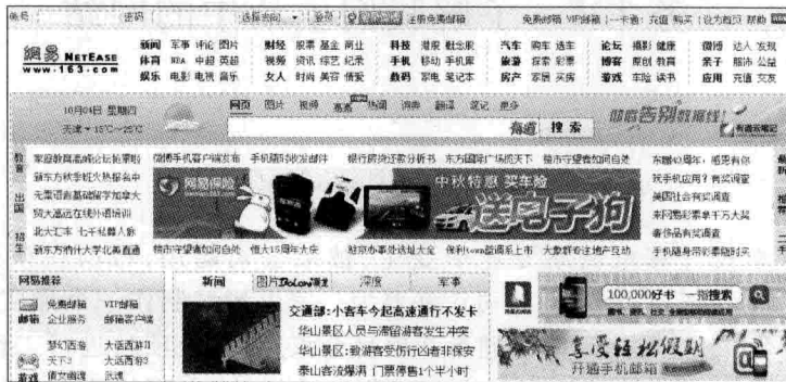
图 1-2 网易