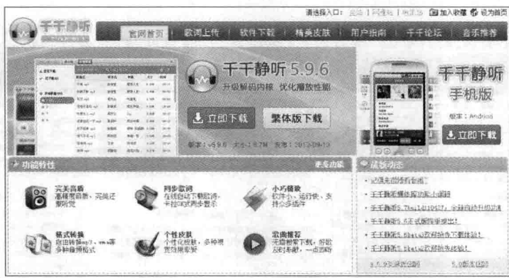
图 1-6 千千静听