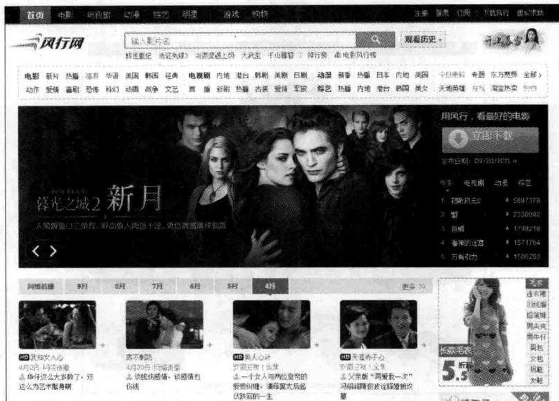
图 1-5 风行网