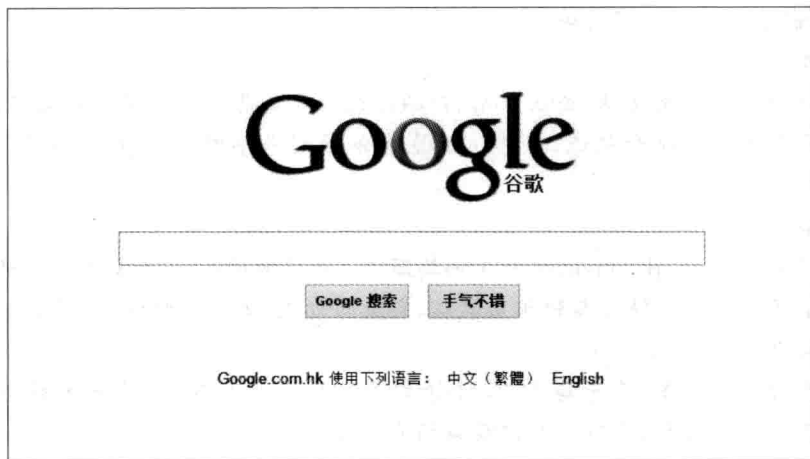
图 1-8 谷歌