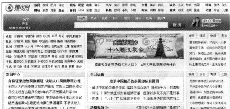
图 1-4 腾讯网