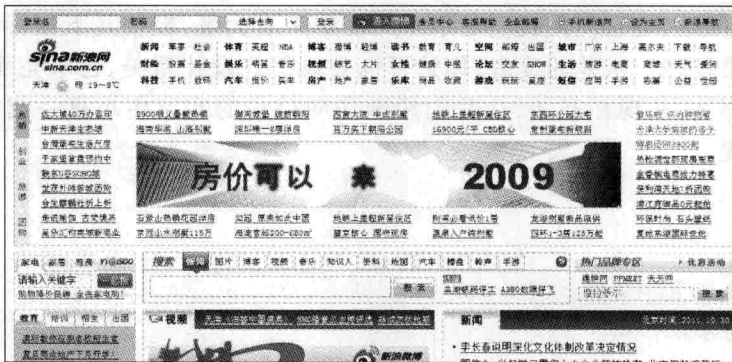
图 1-1 新浪网

如新浪网(www.sina.com.cn,如图1-1所示)、网易(www.163.com,如图1-2所示)等网站。