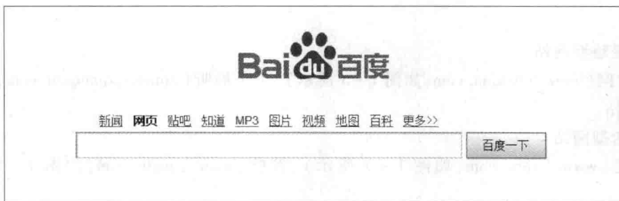
图 1-7 百度