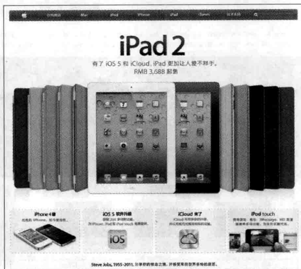
图 1-3 苹果(中国)公司