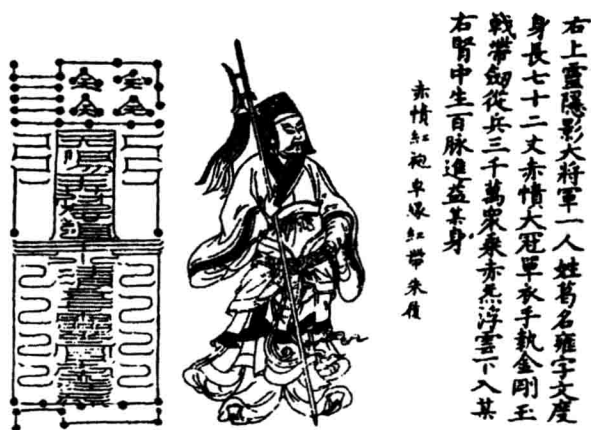
三将军箓,局部,中右上灵隐大将军

曾试图对之稍作解读。而箓的结构,则与符有很大不同,尽管箓中有时也嵌有符,但这种召符只是箓的结构中的一部分。前面引用的《隋书·经籍志》大抵已指明箓的结构。箓的基本内容是记诸仙吏神将名及所统神兵的数目;有时尚绘出其神将形貌;至于错在其间的符,大多与召役该箓上的神将有关。以正一派的《太上正一三将军箓》为例,该箓召役唐宏、葛雍、周武三元大将军,箓中不仅载其名讳,所率神兵数,且述其形貌、衣装武器,并召符,相当典型地表现了箓的一般形制。