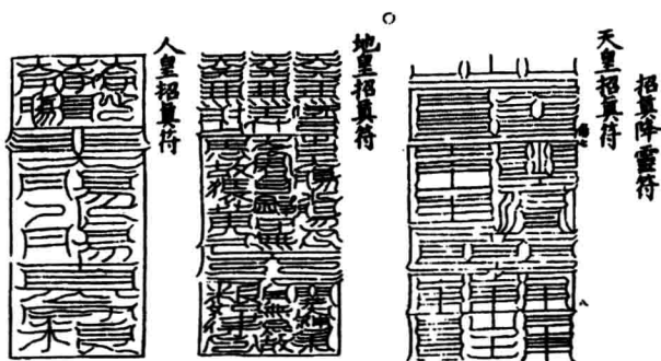
《洞神八帝妙精经》中的符举隅

上引三皇经派的经箬，严格地说，以箬为名的只有一至三卷，而后边为经书和仪范。但可以清楚看出，《洞神八帝妙精经》里所载的为召将、镇邪等用的符，而非箬，也不能混称符箬。此