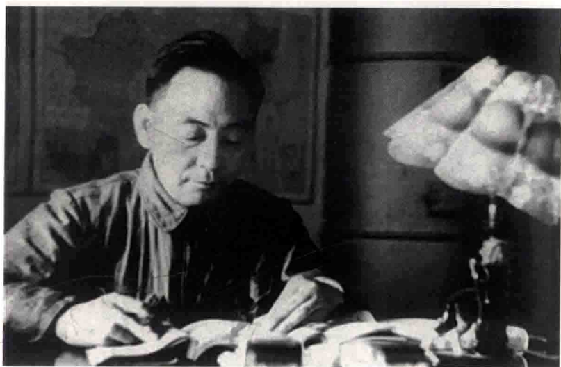
1950年,吕振羽在东北工作照