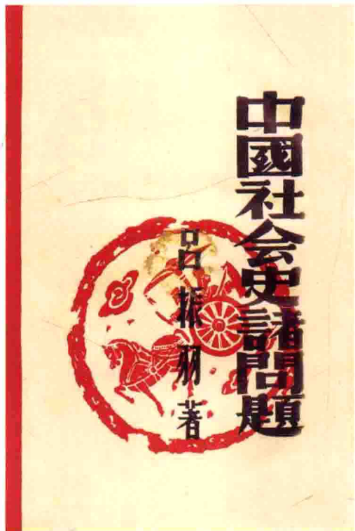
《中国社会史诸问题》书影