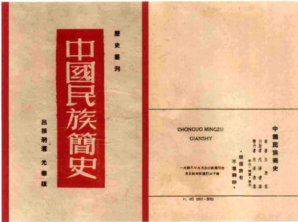
《中国民族简史》书影