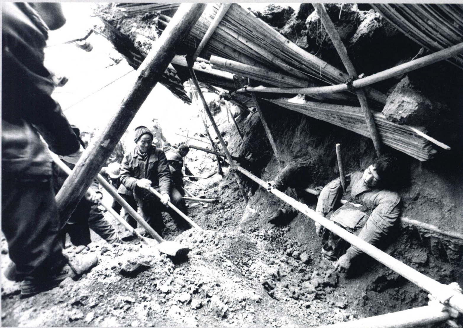
Scene of a building collapse, Xi'an, Shanxi, 2000, by Xie Haitao