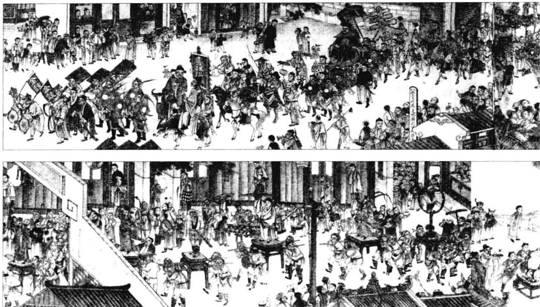
迎春会，近人黄瑞鹄绘。

岑夫人先是一愣，接着笑道：“对，我儿子说得对。”做母亲的见儿子如此用功，既高兴又不免心疼。