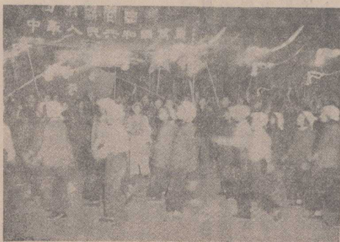
首都人民提燈慶祝。