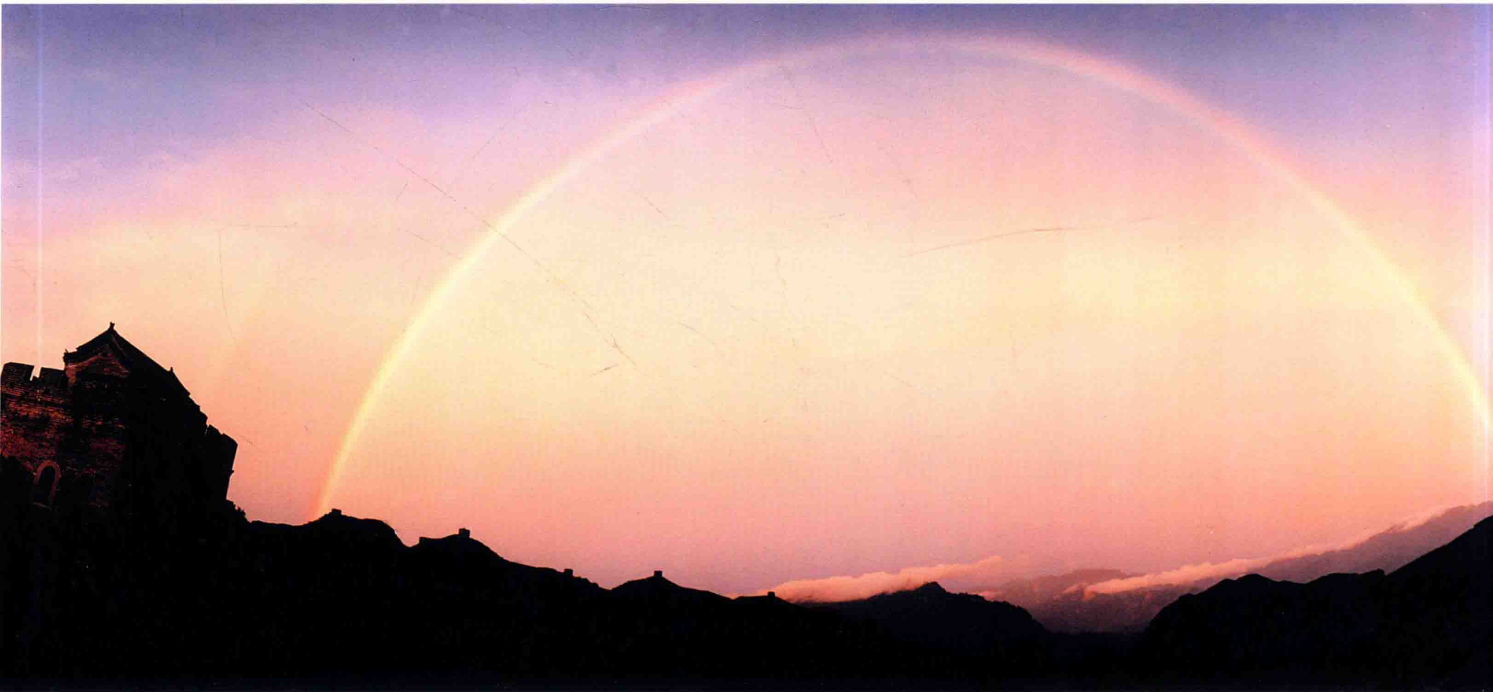
5. 《誰持彩練》1997年，攝於金山 嶺長城，雨後。使用尼康FM-3相機， 20mm鏡頭，富士135彩色負片，ISO- 100，F/16，t:1/30秒。