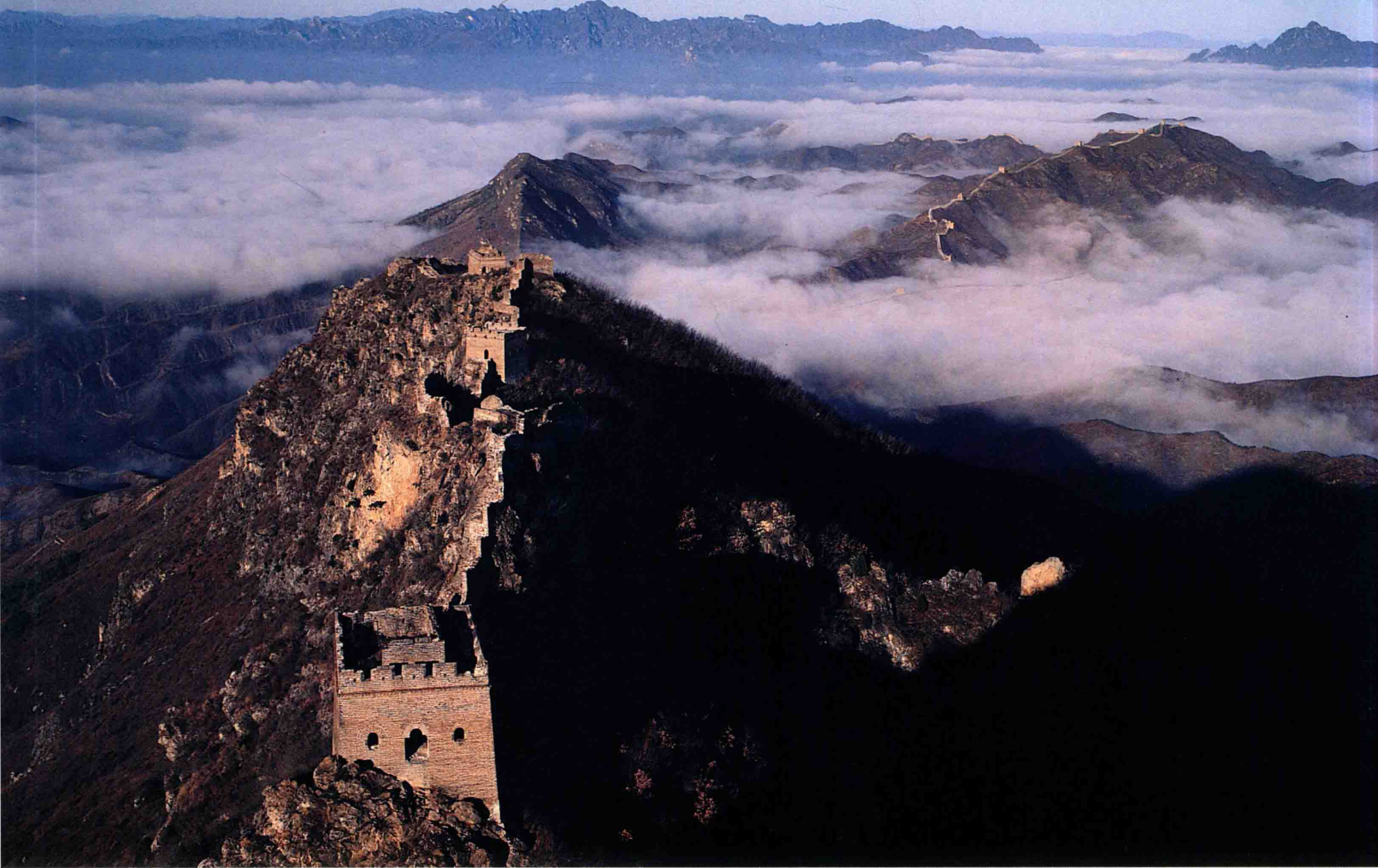
8. 《蒼龍出海》1996年，攝於北京 京郊司馬台長城，雨後，早晨。使用賓 得645相機，150mm鏡頭，1/120彩色 反轉片，ISO-100，F/16，1/128秒。