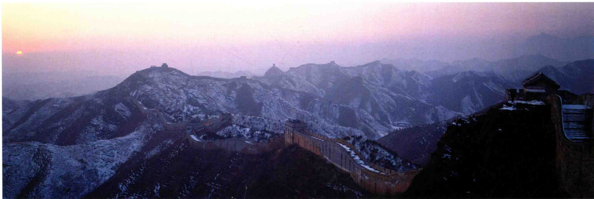
2·《金山雪霽》1991年，攝於金山嶺長城，雪後初晴。使用富士6×17相機，柯達120彩色反轉片，ISO-64，F/8，1/15秒。

曾經偶然地得到過好作品，或者還得過某項大獎。其實，攝影很難，很苦，尤其是風光攝影。在野外作業，且不談攝影器材的重負，單就為捕捉日出或日落，爬山涉水，風餐露宿，就不是一件易事，搞不好身家性命都可能賠上。這都因為“無限風光在險峰”。要拍攝風光，就要與日月為伍，同山河作伴。四季的不同景色，就有四季不同的苦頭。春秋似乎還好些，夏天則頂酷暑，日曬雨淋；冬天則耐嚴寒，臥冰臥雪。運氣好時，還有收穫，否則，敗興而歸是平常事。箇中甘苦，祇有真正的投入者才能體會到。更有甚者，因為對攝影的執著，長年在野外作業，妻兒不理解，造成“妻離子散”的局面者有之。可見攝影人需付出何等巨大的代價！〈下轉P10〉