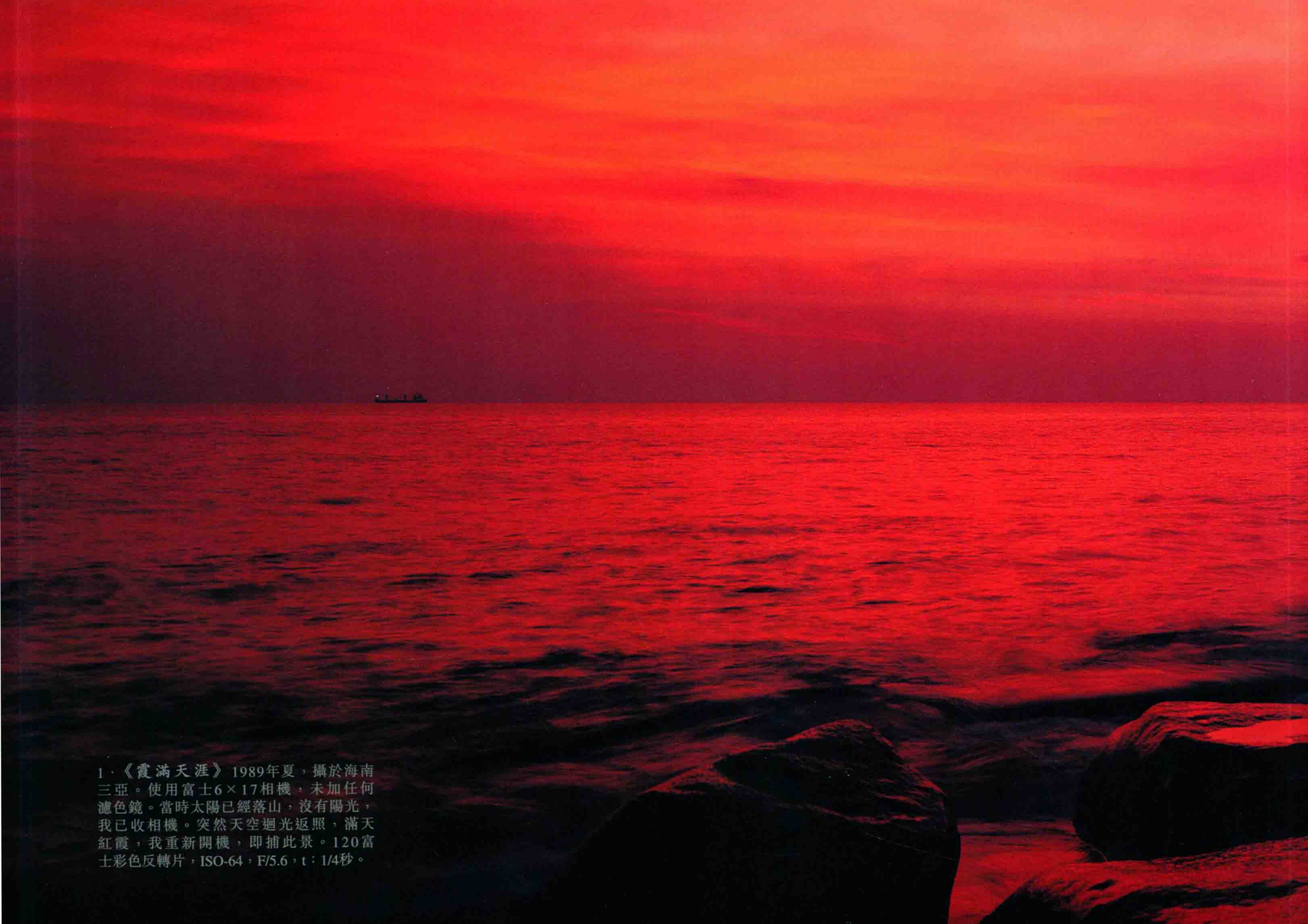
1·《霞滿天涯》1989年夏，攝於海南三亞。使用富士6×17相機，未加任何濾色鏡。當時太陽已經落山，沒有陽光，我已收相機。突然天空迴光返照，滿天紅霞，我重新開機，即捕此景。120富士彩色反轉片，ISO-64，F/5.6，t：1/4秒。