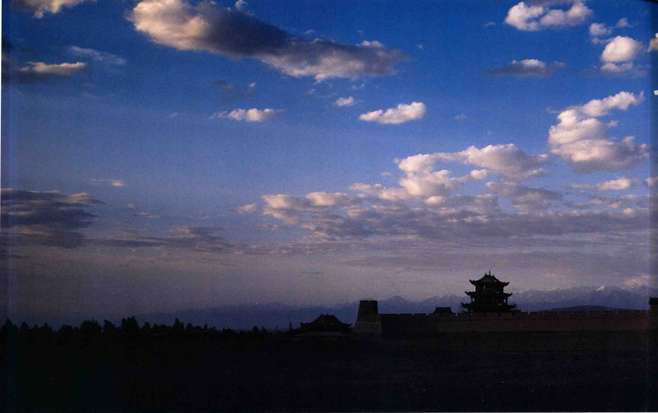
6-《雄關嘉峪》1991年，攝於甘肅嘉峪關。使用富士6×17相機，加爾探鏡。柯達120彩色反轉片，ISO-64，F/22，t：1/15秒。