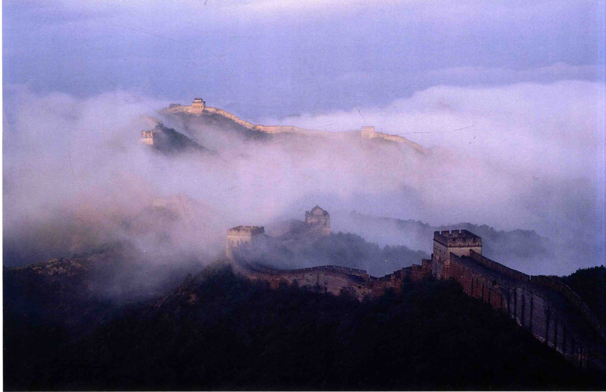
3·《宛若游龍》1996年·攝於金山 嶺長城·雨後初晴·使用賓得645相 機·150mm鏡頭·富士F20彩色反轉 片·ISO-100·F/16·t:1/8秒·