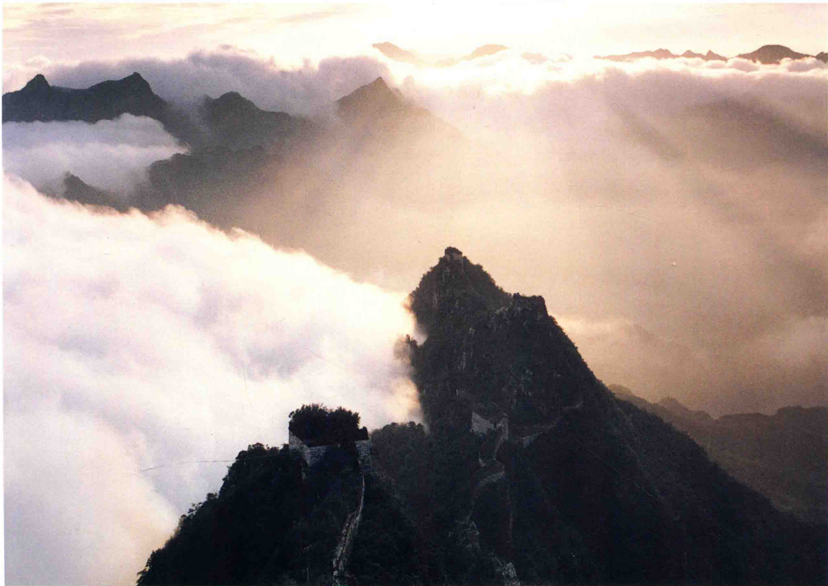
4. 《光流维网》1996年，摄于北京郊外的箭扣长城。雨后，使用尼康FM-2相机，55mm镜头，富士135彩色负片，ISO-100，F/16，1/130秒。