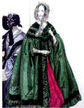
表现服饰与头饰的铜版