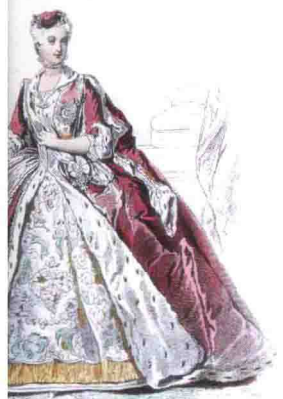
表现欧洲贵族女装的铜版画