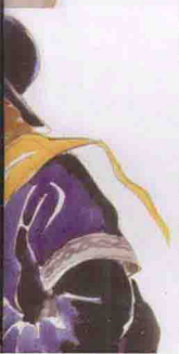
安东尼奥水彩时尚插图作

的效果图是画在白纸上，人物造型简略，但设计意图明确，服装细节交代得非常准确清晰，在大师的手稿当中有一些是画在酒店的便签上面，这是大师在酒店休息时随手记录自己设计灵感时留下的，从中可以看到一名设计师繁忙的生活节奏。从这些服装效果图的演变过程可以看到大师在设计表现上的发展轨迹，那就是越来越高效和快捷，然而设计手稿的简单和迅速并不会导致设计艺术水平的下降，在大师的服装作品面前，那些服装精良的裁剪和精美的细节让我久久难忘，因为那种品位的不断精湛和成熟是可以被感知的。这样就带给我们一个问题：在服装设计当中用于设计思考和设计表现的时间分配比例的问题。在国内，很多学生是轻视思考而注重表现的，用于作业的准备和作业的制作时间配比上制作的时间过长。固然绘制精美的服装效果图会令人感到赏心悦目，但是设计上的创新和理念才是作为一名设计师的终极目标。所以在国外的服装设计教育当中看重的是学生们的服装设计理念，而不是学生们的绘画基本功。作为设计和作为绘画的表现重点是不一样的。在绘画当中，绘画的表现手法与表现方式和画面是一个不可分割的整体，画面的每一个笔触和细节都对画面构成影响，而设计的预想图和最终的设计效果可能是截然不同的，一个在效果图表现上迅速的设计可能是一件深思熟虑的优秀作品，很多国内外服装设计师的手稿已经证明了这一点，因为在构思和完成品中间有表现手段和设计理念的距离。