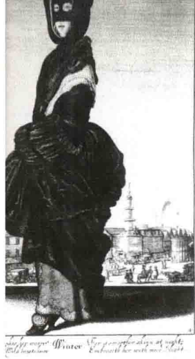
温斯劳斯·荷勒的作品