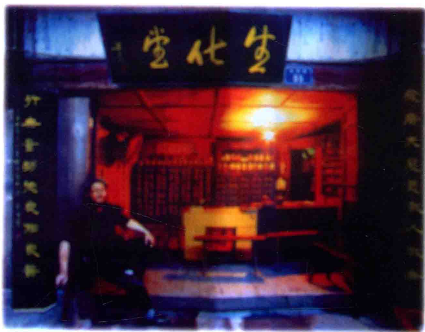
重庆市荣昌县赖溪河畔路孔镇老街生化堂