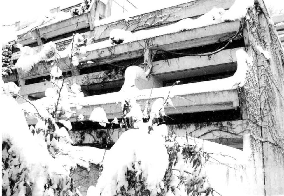
上图：Connollystrasse 31号的后面。人质当时被囚禁在二楼右后方的房间内。

如此，以色列仍然是最需要训练和部署反恐特种部队的国家。1972年5月8日，恐怖分子再一次劫持了一架Sabena航空公司的航班，该航班最终在特拉维夫降落。这一次以色列成功实施了针对恐怖分子劫持飞机的反恐行动，该行动是以色列反恐特种部队解救人质的典型成功案例。其中使用的诸多技巧现在已经被世界各国的反恐特种部队作为行动标准，比如在相同型号的飞机上进行模拟行动，使用伪装帮助救援队伍接近飞机，以及使用诈术（该次反恐行动中有300多名以色列士兵伪装成被释放的巴勒斯坦士兵，他们乘坐伪装的红十字会救护车接近飞机）等。以色列反恐部队最终成功击毙或抓获了劫持飞机的恐怖分子并解救了全部人质。（这里还有个有趣的事情值得一提，参与本次反恐行动的成员中有两人后来担任了以色列总理，他们是埃胡德·巴拉克和本杰明·内塔尼亚胡。其中内塔尼亚胡在行动中负伤。）以色列以实际行动告诉我们，对恐怖分子的暴行我们没有必要退让和妥协，只要拥有专业的救援队伍和国家、人民的支持，我们在应对恐怖袭击时应该展开积极的行动。