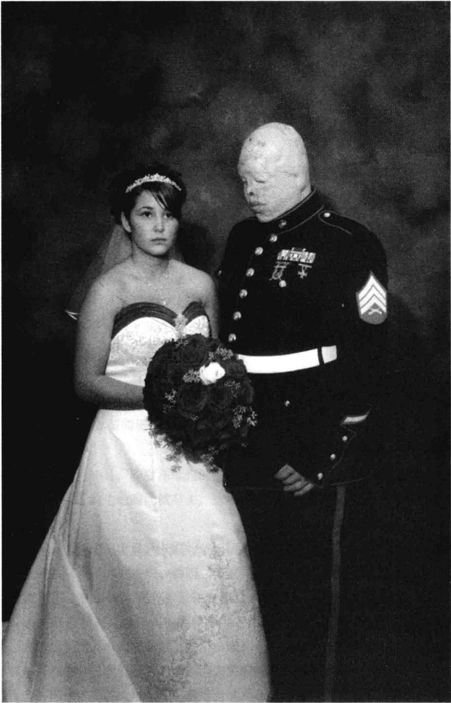
受伤的美军海军陆战队员回国结婚