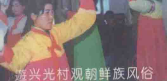
游兴光村观朝鲜族风俗