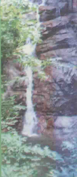
南湖瀑布无上清凉