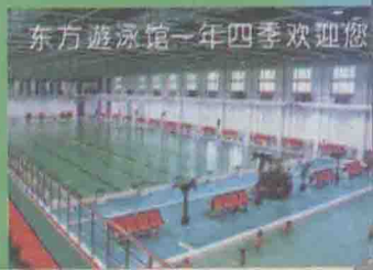
东方游泳馆一年四季欢迎您