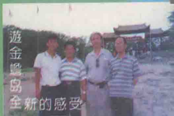
游金蟾岛全新的感受