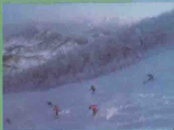
松花湖滑雪场任君驰骋