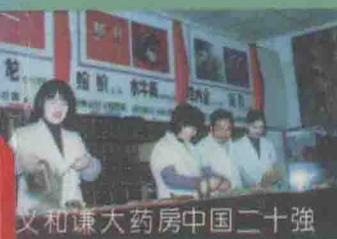
义和谦大药房中国二十强