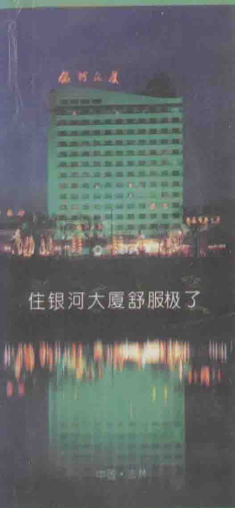
住银河大厦舒服极了