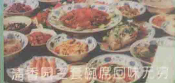
清香园三餐碗席回味无穷