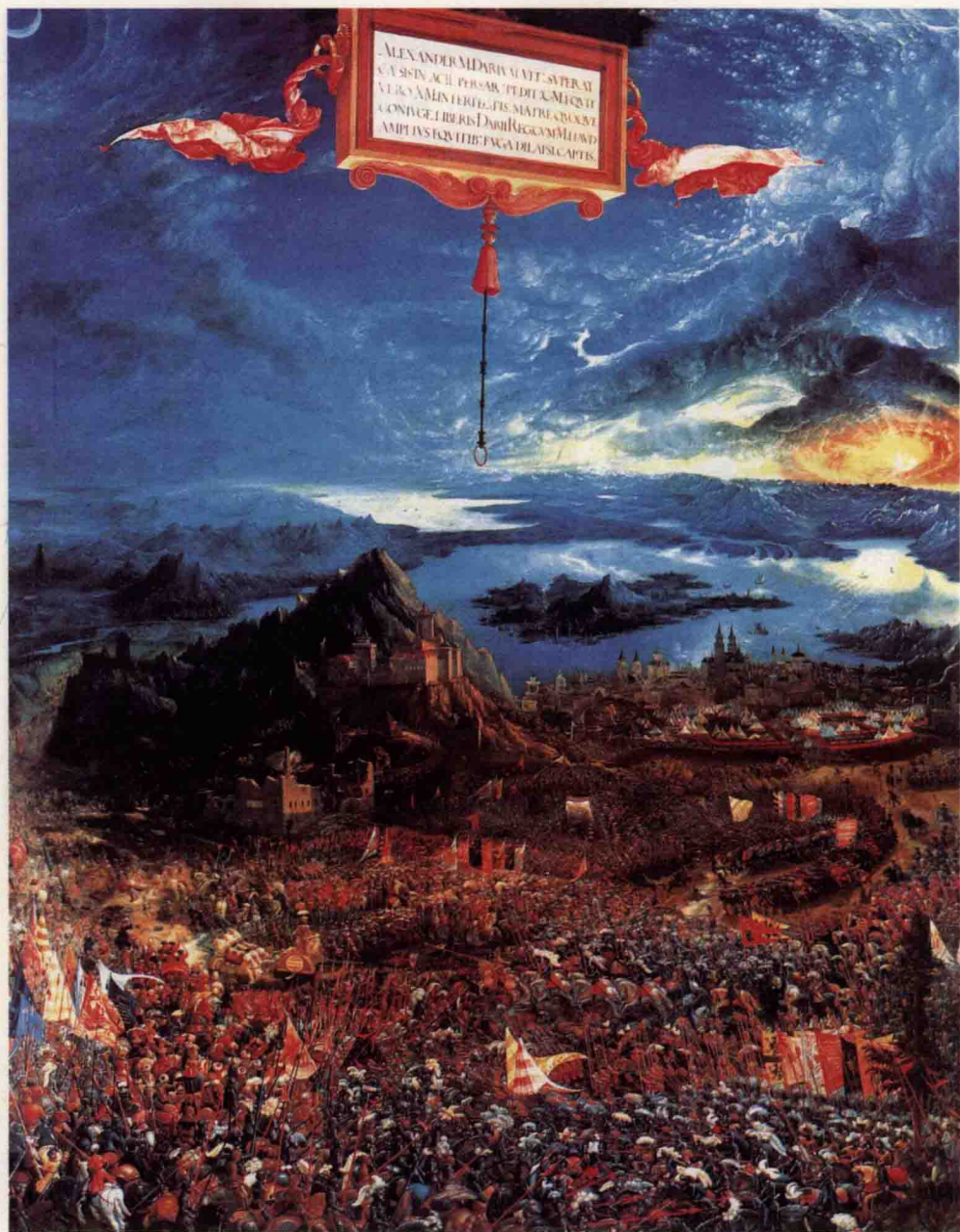
亚历山大的伊苏斯之战 阿尔布雷希特·阿尔特多费尔 德国 板面油画 1529年 德国慕尼黑旧画廊收藏

伊苏斯之战是波斯国王大流士与马其顿大帝亚历山大之间的一场决定性战役。位于图中左方位置坐在马拉战车上的的是亚历山大大帝，画上方吊着一幅巨大的镶板装饰，说明了亚历山大大打败大流士的战绩，也突出了亚历山大大帝想要征服整个世界的野心。整个场面充满了戏剧性的冲突和强烈的战争气氛。