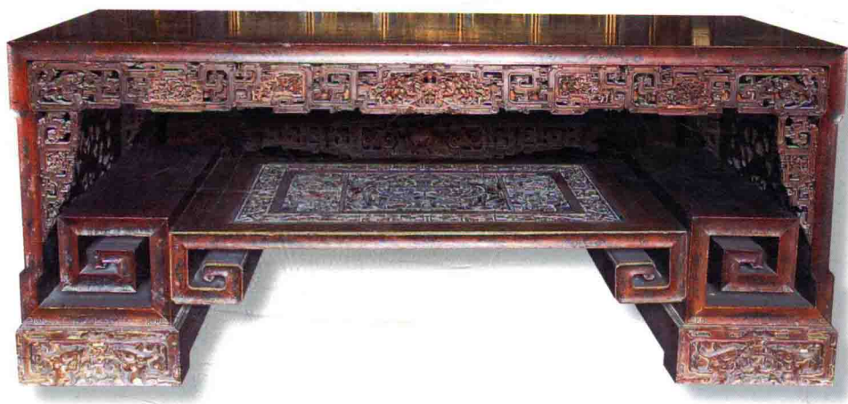
圖 1-2 豐富的雕刻及墨繪技法，表現出臺灣傳統供桌精緻華麗之美

◎民國五十年代以前，由漢民族製作、使用的傳統或變體風格家具。漢族分類還包括有河洛與客家兩大族群，因此漢族家具也同樣分有「河洛族風格家具」與「客家族風格家具」兩類分支；而原住民族群的部分，則因為他們生活習慣所傳留的家具較少，所以目前尚無細項分類。