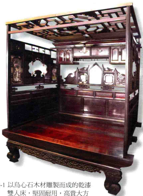
圖 2-1 以烏心石木材雕製而成的乾漆雙人床，堅固耐用，高貴大方

除了以上床形，臺灣傳統的床座還有「羅漢床」、「貴妃床」、「大櫃床」（錢櫃床），這些名稱比較特殊的床形。其中羅漢床和貴妃床的造形跟功能，似床似椅，平時可當做椅子使用，睡覺時則為床座，與一般的床座不同，相當有趣；而姑娘床指的是尚未出嫁的姑娘所睡的單人床；大櫃床最特別的地方，則是將錢櫃的上方改為臥具，睡起來別有一番感受。