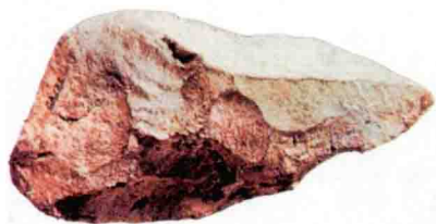
原始的三棱尖状石器

《易经》说：“民物相攫，而有武矣”，原始社会为了争夺食物，各部族为了生存，相互间要进行残酷的争斗，没有武术技艺很难取得生存的权利。1959年在晋南芮城西侯度村发现的西侯度文化遗址中就找到了