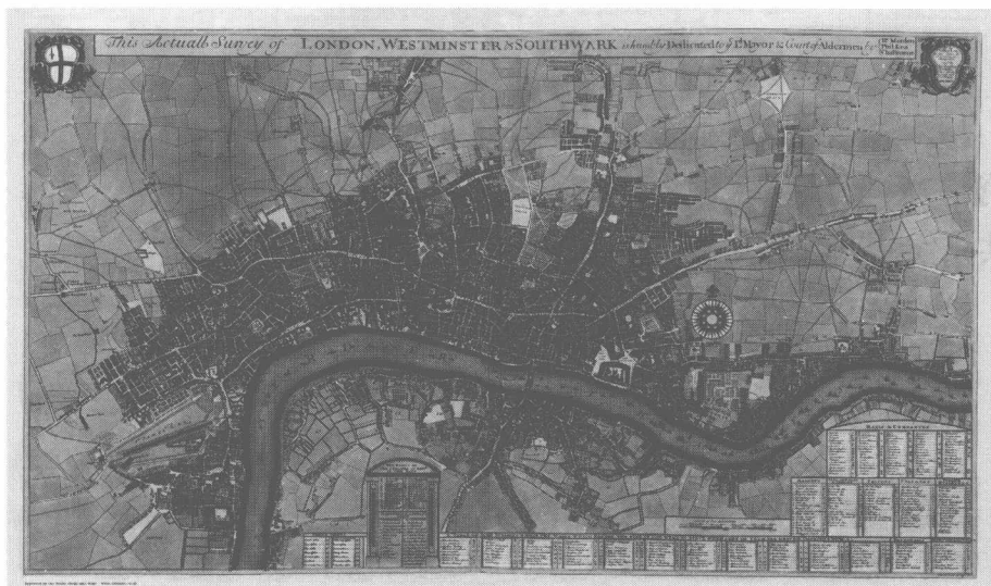
图 1-1 1700 年的伦敦城区图

Fire of London), 随后的数十年都在重建。随着詹姆斯二世即位, 基督新教贵族和天主教国王之间的战争终于爆发。最后, “光荣革命”以基督新教贵族的胜利结束。刚进入 18 世纪, “光荣革命”的胜利者威廉二世去世, 安妮成为斯图亚特王朝的末代女王。1714 年安妮女王去世, 英国迎来了来自德国的汉诺威公爵乔治一世, 而这位国王甚至连英语都不会说。