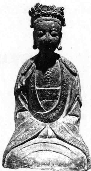
观音菩萨像 宋代铜观音菩萨像