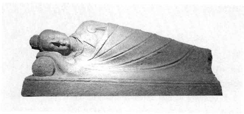
卧佛石像 宋代卧佛石像