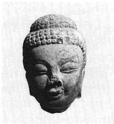
佛头像 宋代佛头像

虽然宋代的疆域范围有限，但是文化与思想的传播没有界限。佛教在整个中华大地上的影响比起以往可以说是更加广大，因此虽然宋代没能做到“溥天之下，莫非王土”，中华大地却都有佛香缭绕，佛乐飘飘。到了元代，由于疆域的扩大加上设立佛教国师的影响，佛教更是得到了巨大的发展。