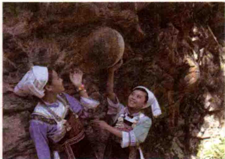
水族姑娘在看进入预产期的石蛋

在贵州省黔南布依族苗族自治州东南部三都水族自治县境内,有座山很奇特,满山绿树成荫,唯独在山腰上裸露出一块崖壁。当地人都习惯把它叫做“产蛋崖”。这块崖壁长 20 多米,高 6 米,表面极不平整。而石蛋就在相对凹进去的崖壁上安静地孕育着,有的刚刚露头,有的已经生出了一半,有的已经发育成熟眼看就要与山体分离,千百年来这座山崖不停地生出石蛋来。据村里的老人介绍,产蛋崖壁上有很多个会产蛋的石窝。其中有一个石窝每隔 30 年就会有与恐龙蛋相似的石蛋自动脱落。据三都县旅游局披露,从 1999 年以后的 10 年间,这一产蛋崖壁产出了石蛋 5