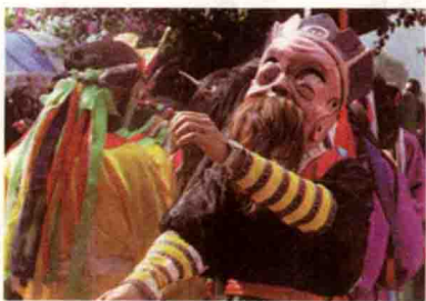
贵州非物质文化遗产之:布依戏

什么是“黎民”?我们现在经常听到的“黎民百姓”这个词语,是指普通老百姓。在传说中,几千年前,在黄河流域集中着黄帝族、炎帝族、夷族和九