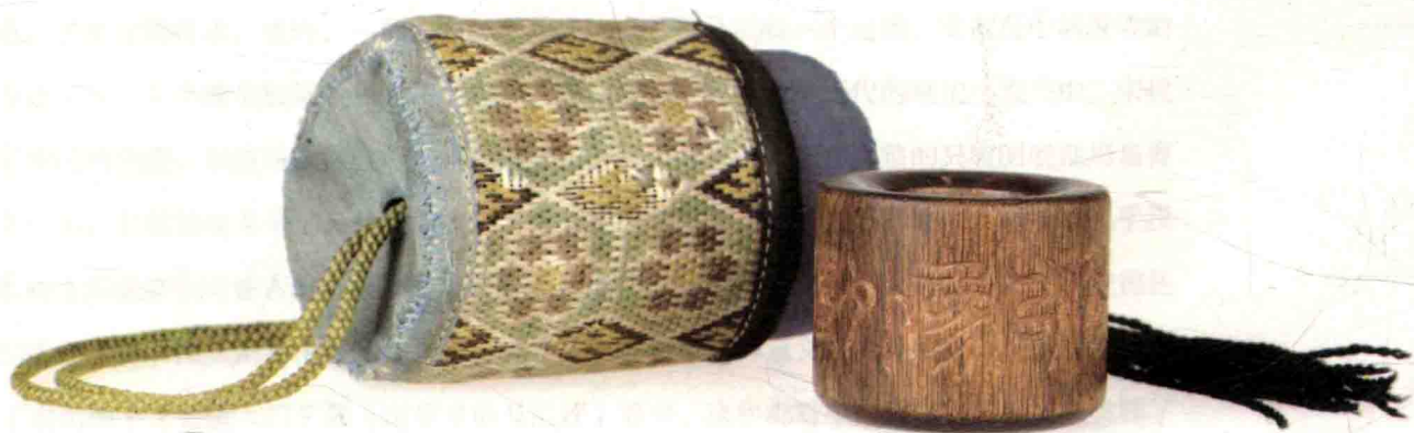
清 原囊套奇楠香扳指