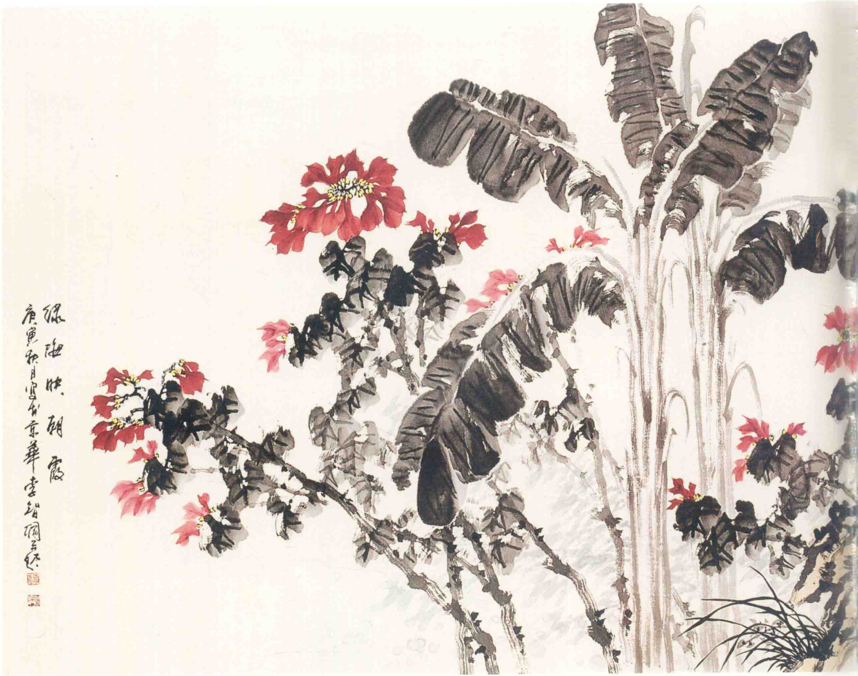
© 绿海映朝霞 2010年 纸本 142cm × 360cm