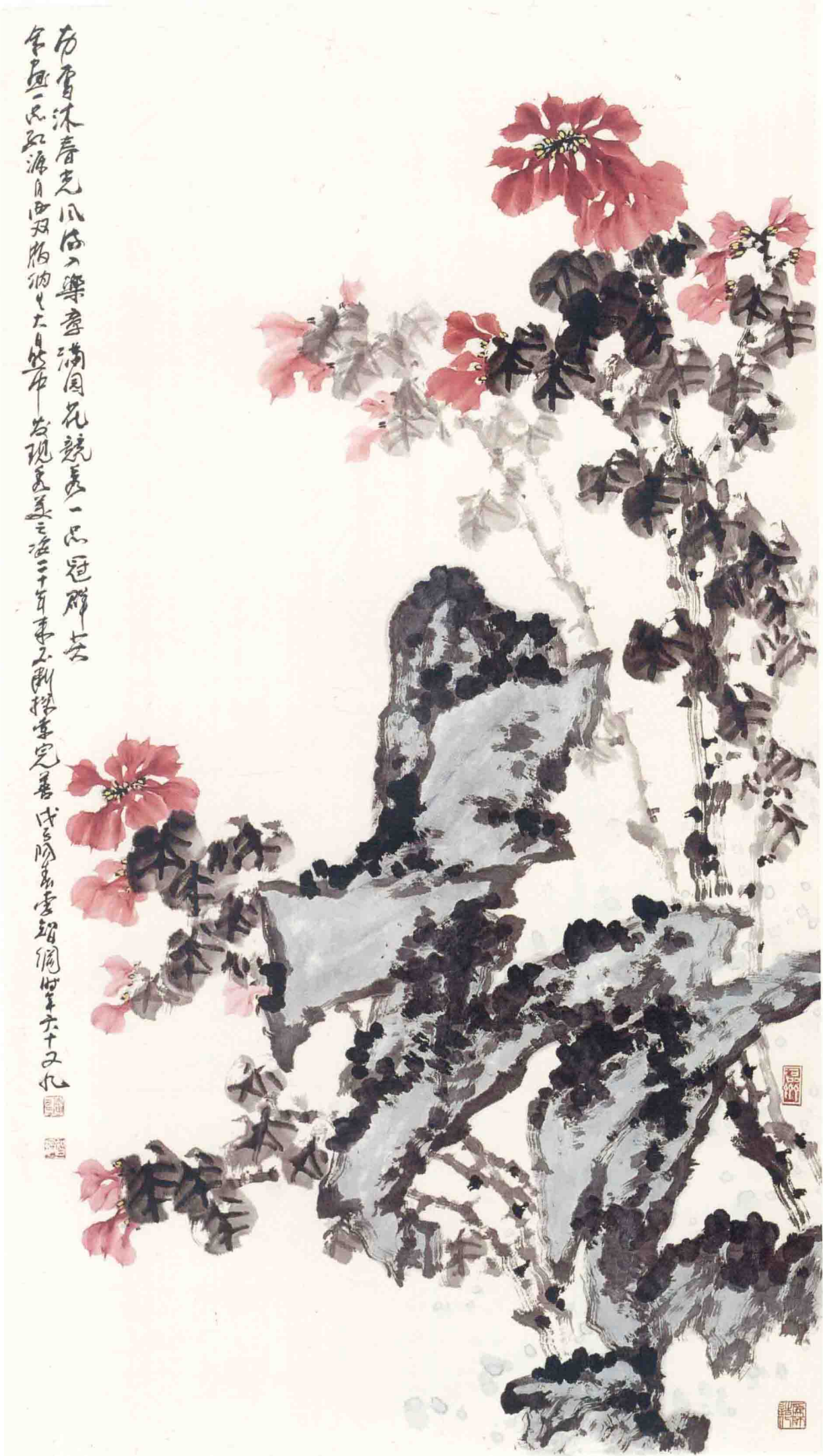
◎ 历雪沐春光 2008年 纸本 178cm × 98cm