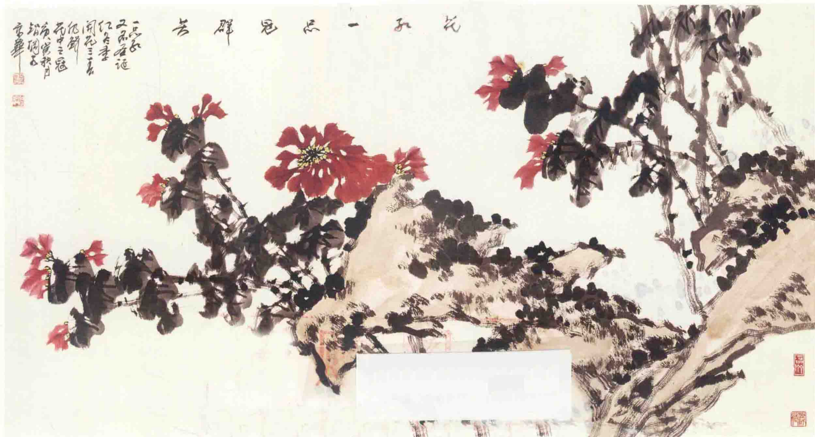
◎ 花红一品冠群芳 2010年 纸本 98cm × 178cm

中国绘画的成熟发展，及其炉火纯青的技艺高度，为当代中国画的走向和前行，提出了新的命题，即在前人成果的基础上，如何创造出符合当代审美需要的作品？这是一道艺术创新的课题。它无可回避地检验着当代画家的智慧和才情，也是我们评判当代画家及其作品的价值、意义的重要标准。