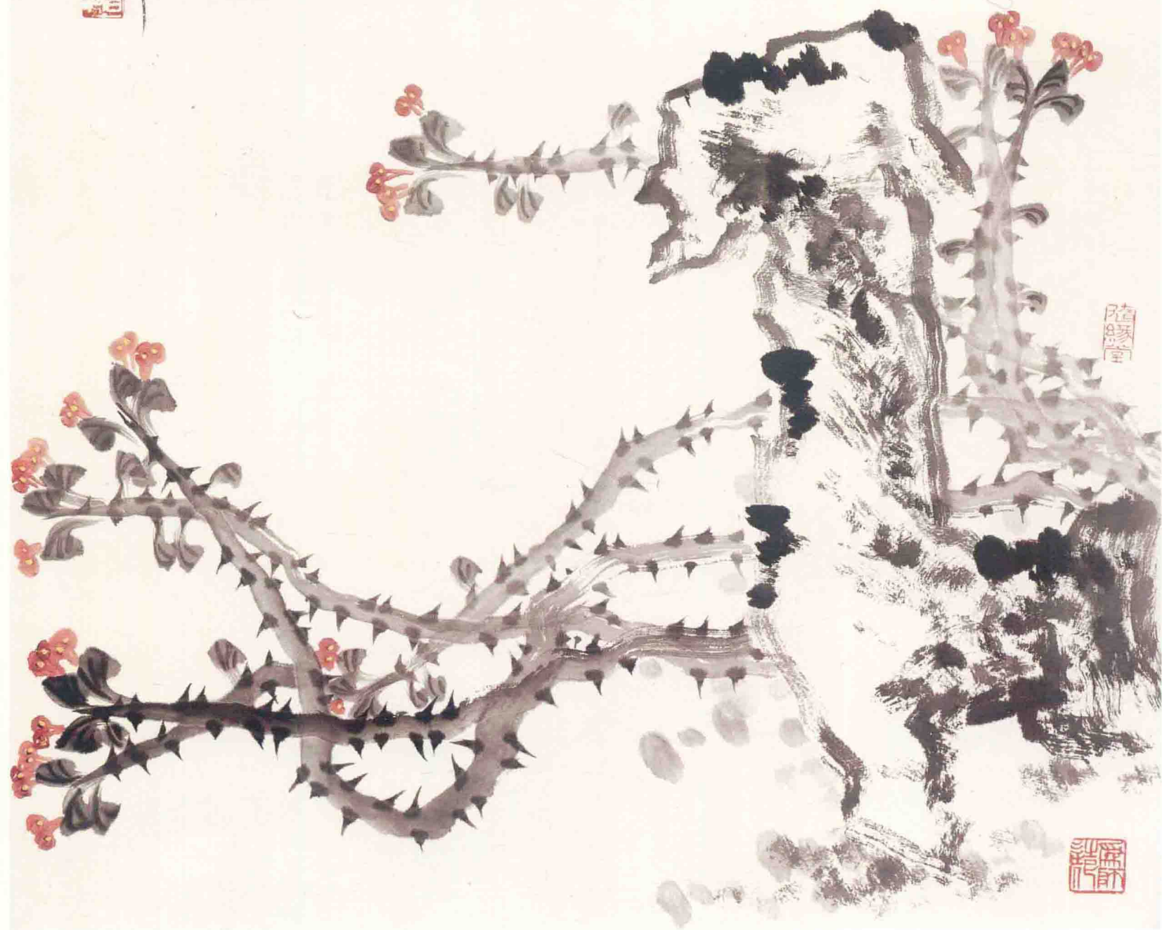
© 闲中立品无人识 2006年 纸本 68cm × 68cm

以线为主，用笔刚柔相济是李智纲先生的特长，且在用笔中，带动墨色变化，并与笔墨之中，或干枯、或含水，一笔下去黑中见灰，深灰隐于内，浅灰隐于外，画面中，深黑中，深中因而见浅，犹重中透光；浅灰色如朦胧雾霭，柔中见刚；如此变化与层次表现，均系借水而出，流于笔锋，点、线一体，浑然氤氲，皴擦干湿，入于纸背，滋润婉转，酣畅淋漓，急缓之中，苍茫枯寂与温婉柔美，俱现于笔下。此笔法，乃心性使然，修养使然，苦学使然，“以技入境”由此过程得以完成，达到虽“小景而有大雅”的效果。