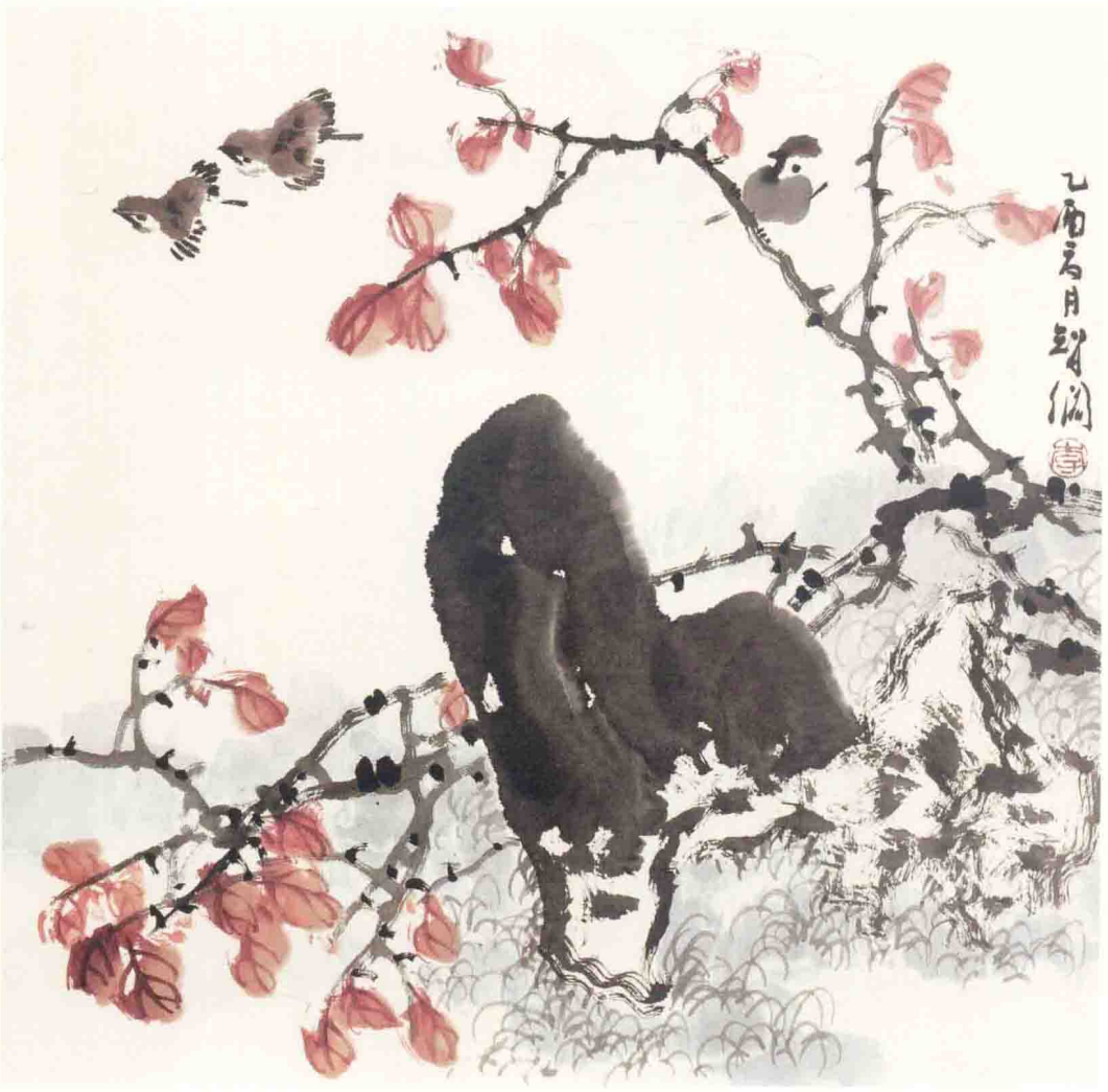
◎ 霜后 2005年 纸本 68cm × 68cm