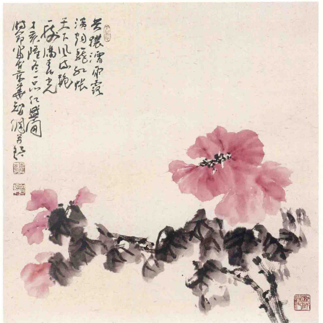
◎ 天下风流艳 2007年 纸本 68cm × 68cm