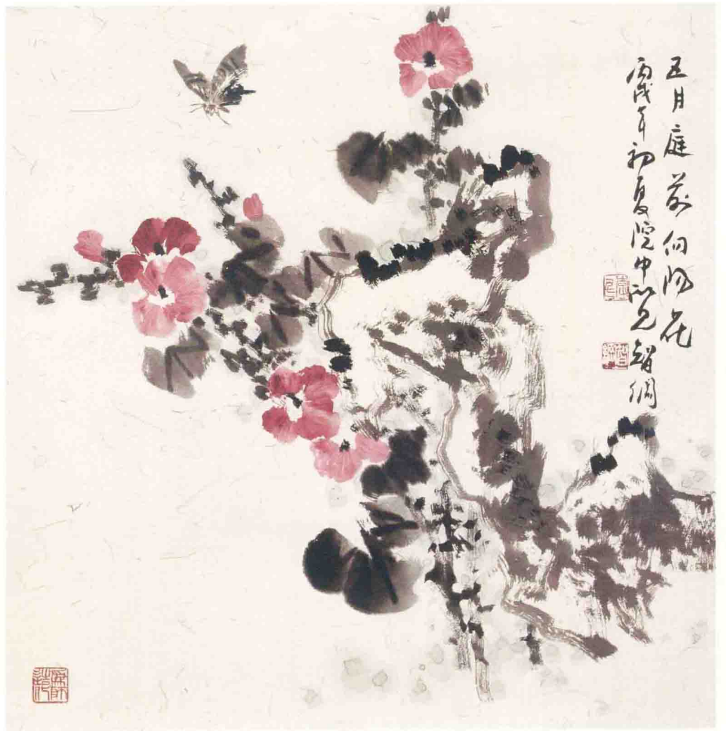
◎ 五月庭前向阳花 2006年 纸本 68cm × 68cm