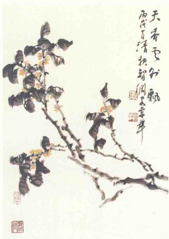
◎ 天香云外飘 2006年 纸本 68cm × 45cm