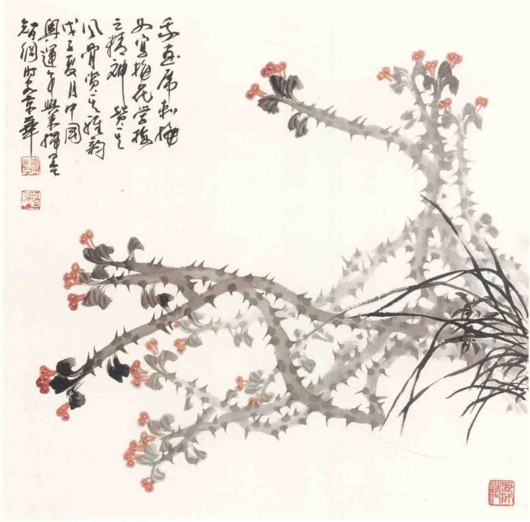
◎ 兰香梅骨 2008年 纸本 68cm × 68cm