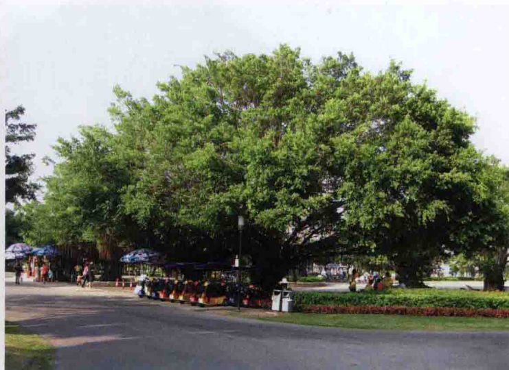
彩图 4-16 榕树 (小叶榕)