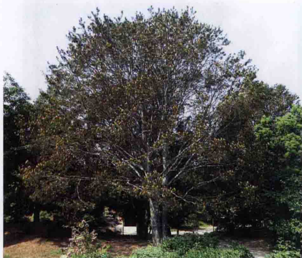
彩图 4-6 白皮松