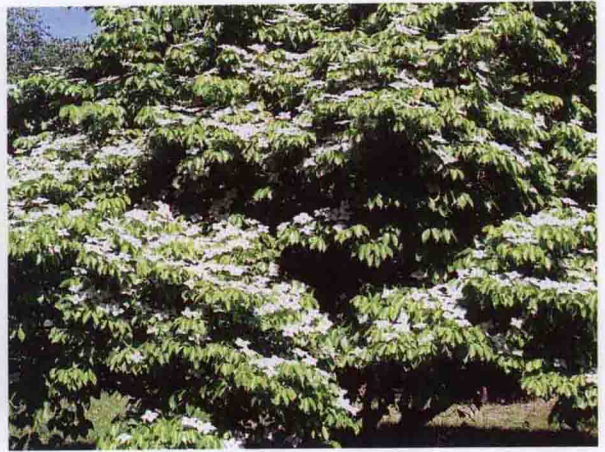
彩图 4-57 四照花