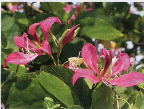
彩图 4-20 红花羊蹄甲