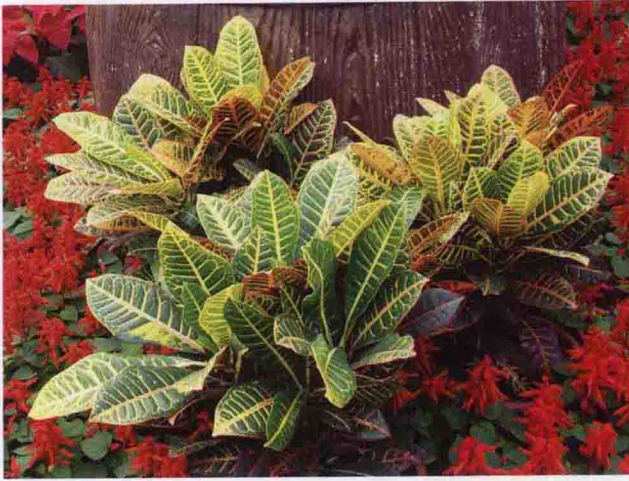
彩图 5-13 变叶木