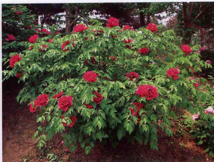
彩图 5-25 牡丹