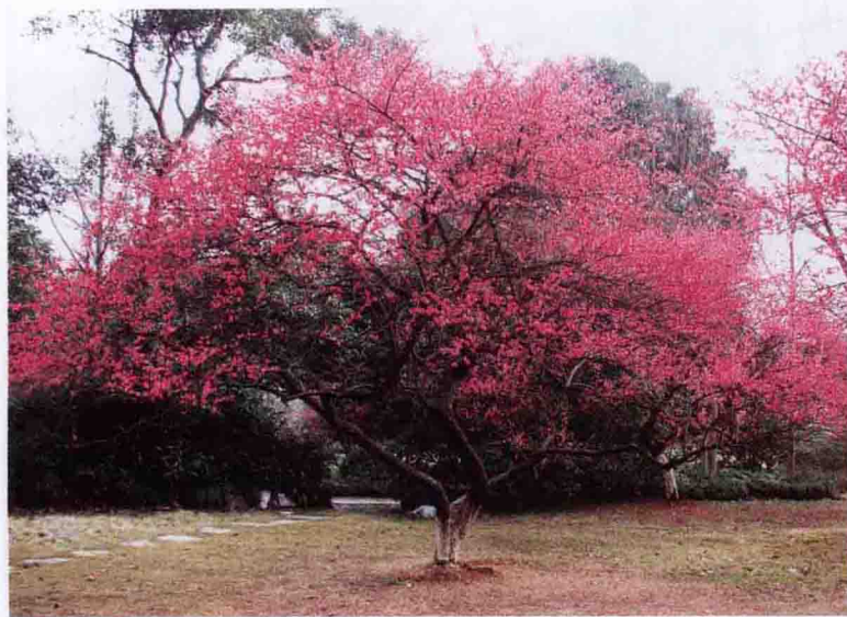
彩图 4-43 梅