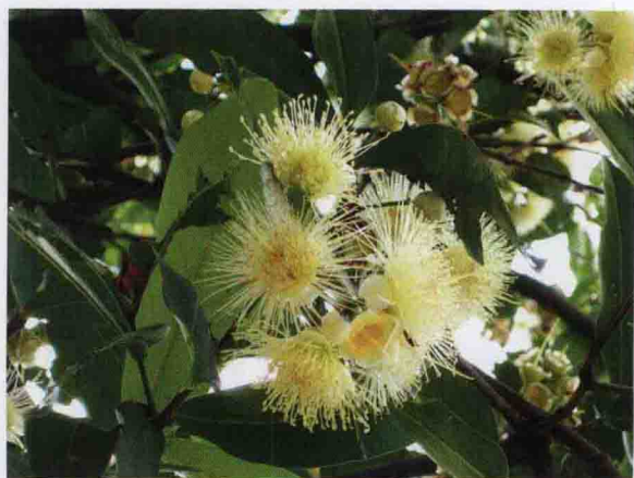
彩图 4-21 洋蒲桃花