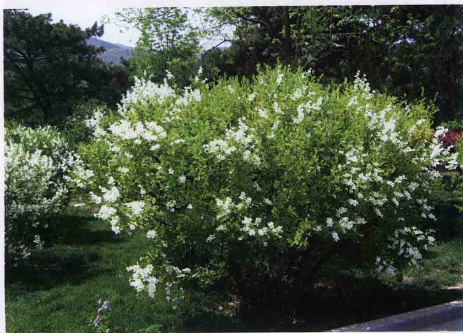
彩图 5-32 白鹃梅