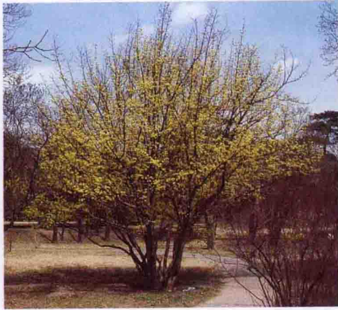
彩图 4-56 山茱萸