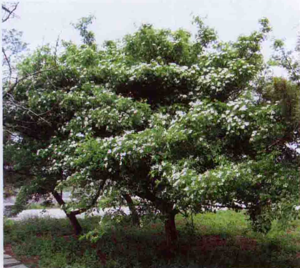
彩图 4-42 山楂