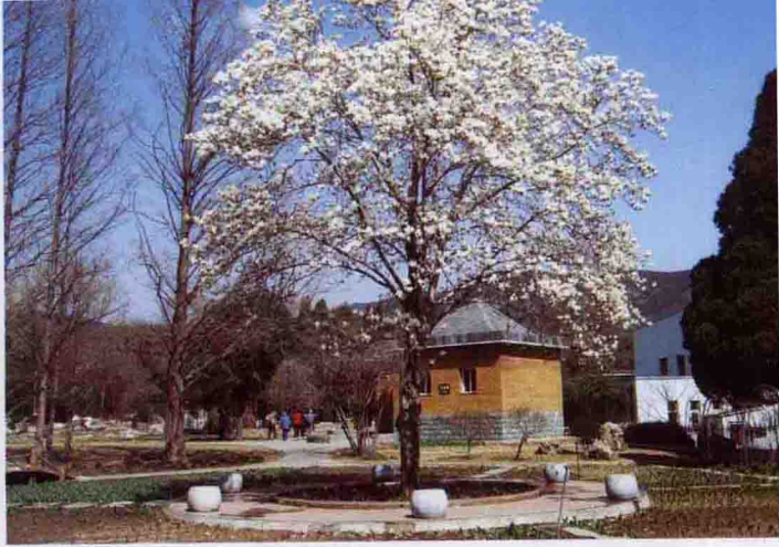
彩图 4-29 玉兰