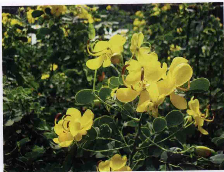
彩图 4-49 黄槐