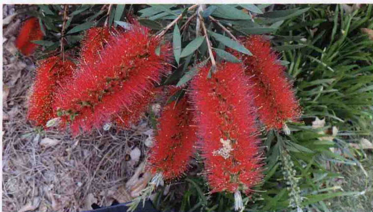
彩图 5-8 红千层