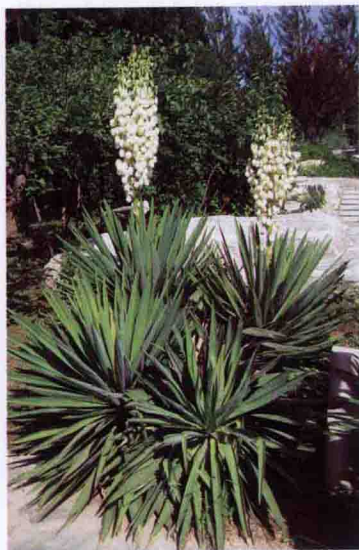
彩图 5-23 凤尾兰