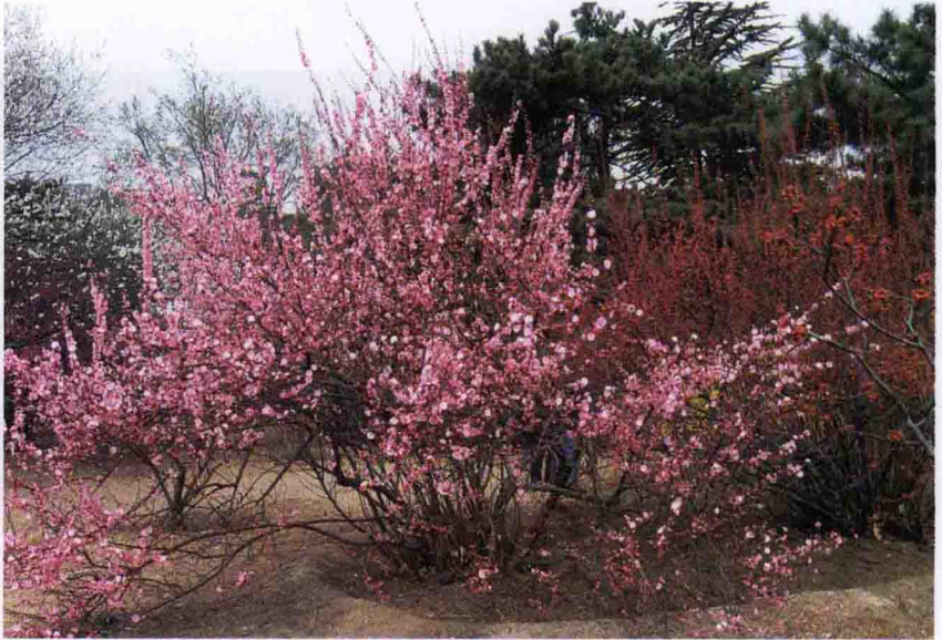
彩图 5-34 榆叶梅