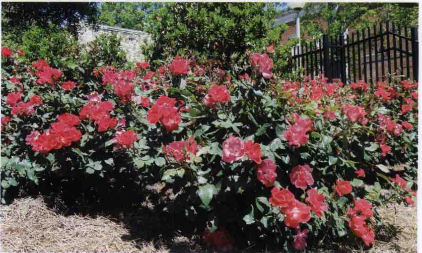
彩图 5-35 现代月季