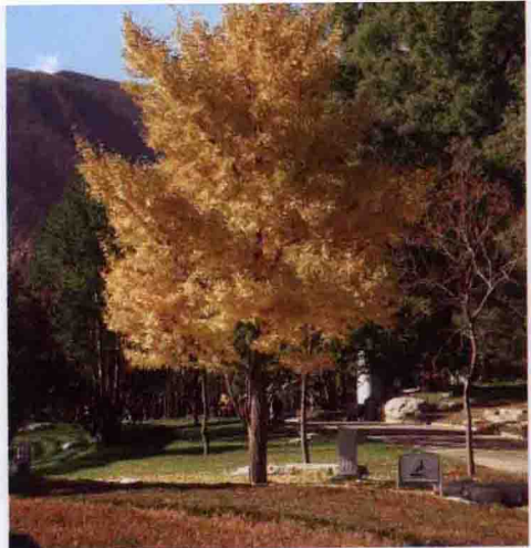
彩图 4-27 银杏