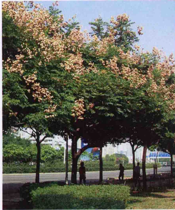
彩图 4-58 栾树