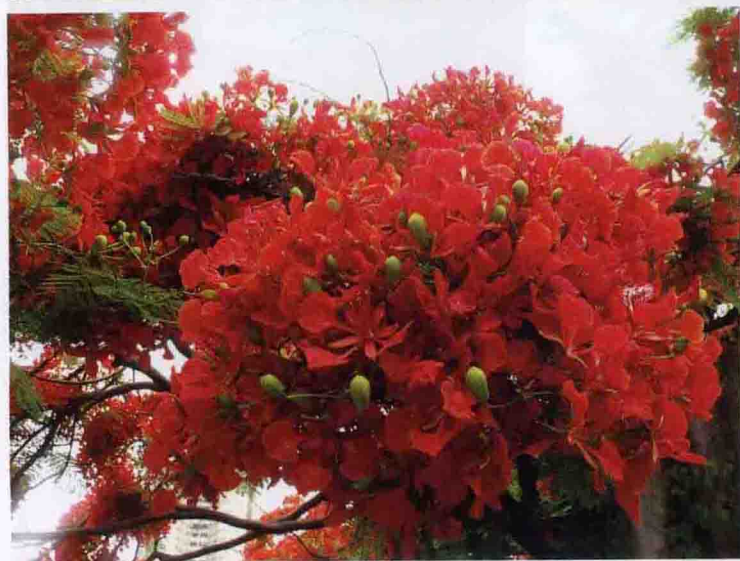
彩图 4-50 凤凰木 (b) (a) 凤凰木整株; (b) 凤凰木的花