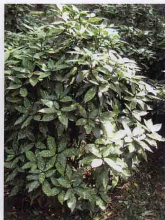
彩图 5-9 '洒金' 东瀛珊瑚