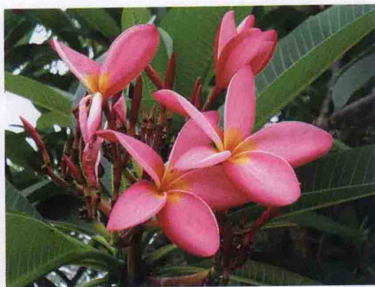
彩图 4-64 红鸡蛋花