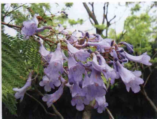
彩图 4-70 蓝花槿