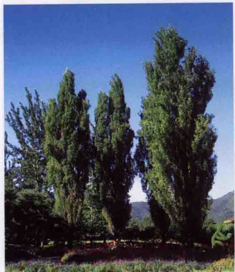
彩图 4-39 '钻天'杨