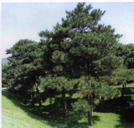
彩图 4-7 油松