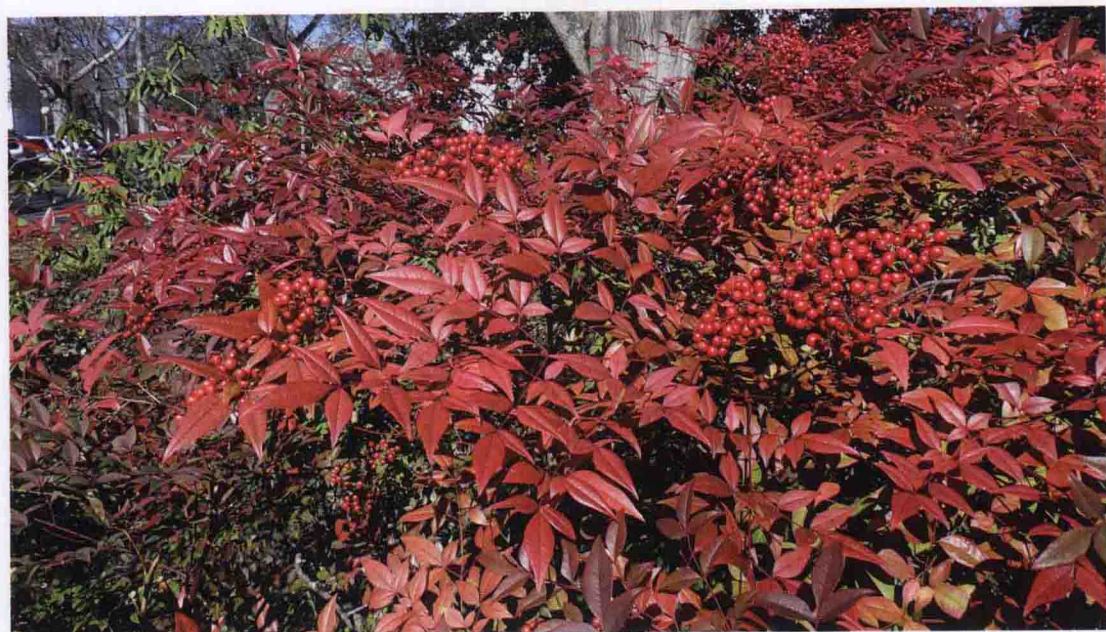
彩图 5-2 南天竹秋冬红叶红果