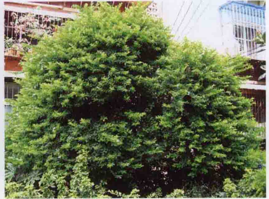
彩图 5-19 '金叶' 假连翘