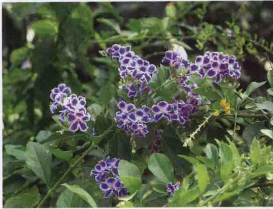
彩图 5-18 假连翘