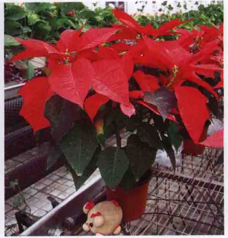
彩图 5-14 一品红