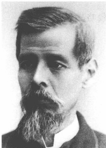
日本外务大臣陆奥宗光(1843—1897)

日本外务大臣陆奥宗光在其所著《蹇蹇录》第一章中洋洋得意地宣称：“将来如有人编写中日两国间当时的外交史，当必以东学党之乱为开宗明义第一章。”日本抓住东学党起义这个时机，挑起了甲午战争，使日本跻身于列强之