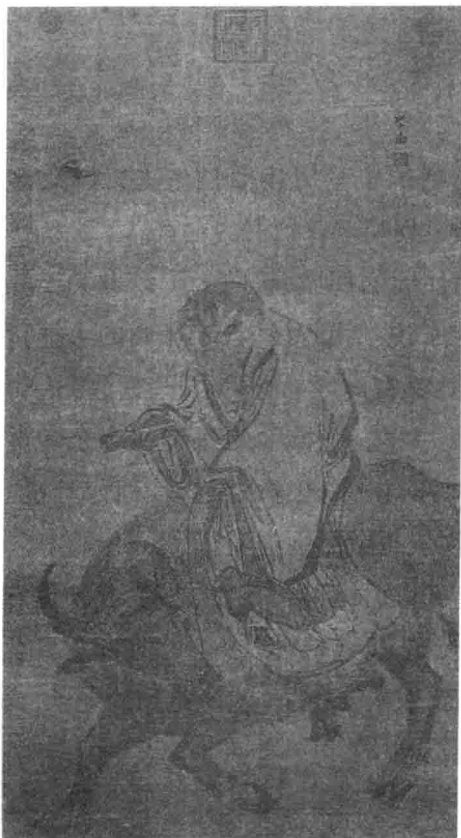
【明】张路《老子骑牛图》