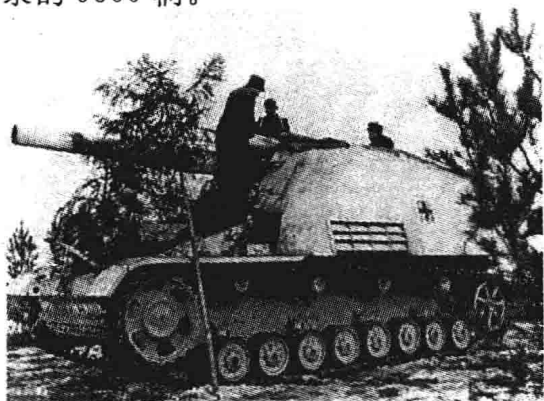
苏军的自行榴弹炮

仅能及时补充战场上的损失，而且能大量装备部队，在这年的春夏之交，苏军拥有的坦克和自行火炮达到创纪录的9500辆。