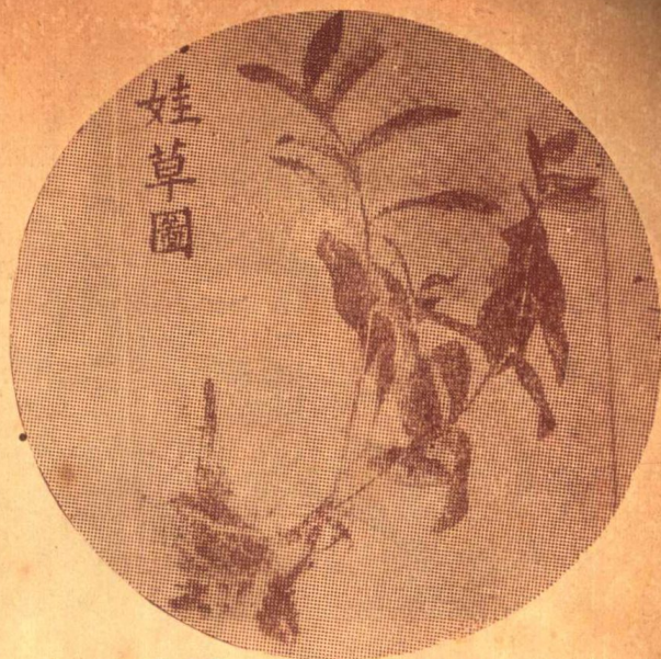
娃 草 圖