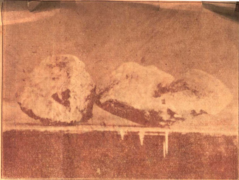
翻 天 印 圖