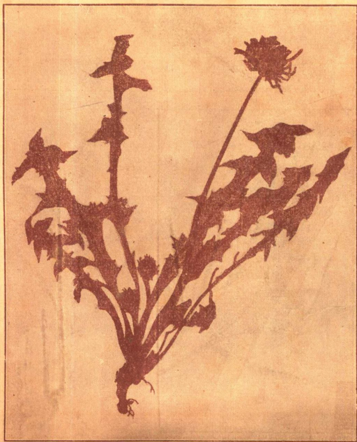
東 風 菜 圖