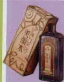
• 「にきひとり」美顏水，1928