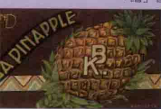
• 「AEROPLANE BRAND」鳳梨罐頭，1930s