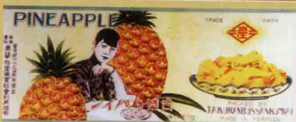
• 「卓蘭物產購買販賣利用組合」鳳梨罐頭, 1930s