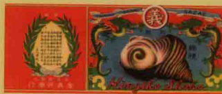
• 金義興商行「螺螺罐頭」, 1930s