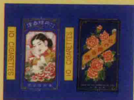
• 牡丹牌香菸, 1938