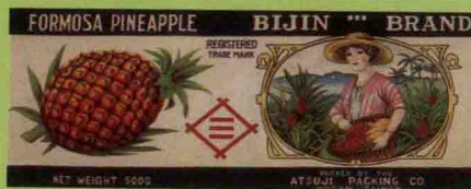
• 「BIJIN BRAND」鳳梨罐頭，1910s