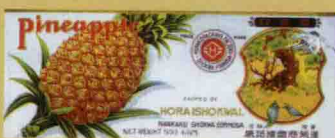
• 蓮萊商會「鳳梨罐頭」, 1930s