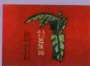
• 芭蕉餡 1930s