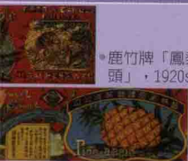
• 鹿竹牌「鳳梨罐頭」, 1920s