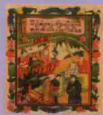
• 台灣炮竹煙火株式會社包裝, 1920s