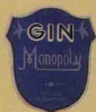
• Monopoly Gin，1938