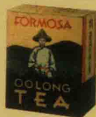
• 台灣茶商公會烏龍茶, 1939