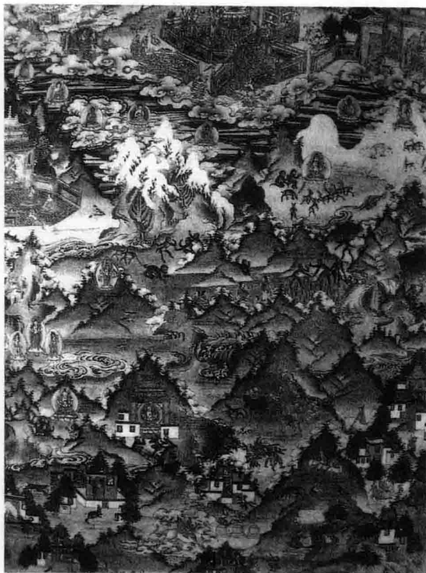
雪域猴子变人的唐卡画