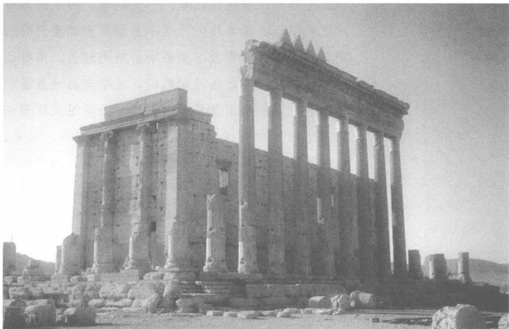
叙利亚帕尔米拉古城遗址 site of Palmyra。

从1096—1291年的近200年期间，欧洲十字军共发动八次东征战役。第一次东征发生在1096—1099年期间。欧洲十字军分四路进攻，最后占领耶路撒冷，杀戮7万人，并效仿法兰西模式建立了耶路撒冷拉丁王国。第二次东征发生在1147—1149年期间。此次东征的目的是为响应耶路撒冷国王的求援要求，旨在杀回被突厥军队收复的埃德萨地