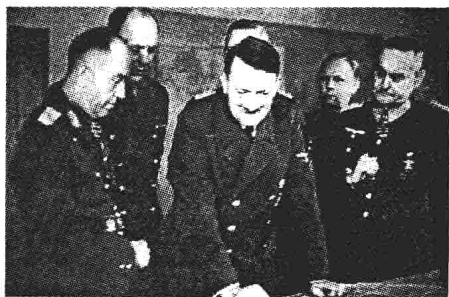
希特勒与罗马尼亚元帅(左一)研究战况