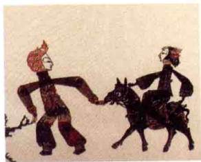
图 9 河北唐山皮影赶脚(中国美术学院皮影博物馆藏)

笔者幼时在家乡经常看皮影戏，但上小学后，有近三十年的时间没有接触过这一民间艺术。真正再次接触皮影戏并着手研究它，是 2004 年 9 月进入中山大学读博的时候，屈指一算，迄今已有八个多年头了。其间虽出版了四种皮影