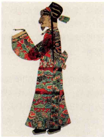
图4 浙江海宁现代皮影（文官）

4. 影窗。亦称“亮子”“银幕”“屏幕”或“唱戏的窗子”等，是皮影戏演出时用来显影的装置，在观众区和表演区的交界处，幕前是观众区，幕后是表演区、“后台”。一般是用木条装订成一个长方形框子，再在方框内绷上投影用的布帛或纸张以投影。皮影戏的表演要依托影窗投影，因此影窗的材质要透明、耐用。早期在木框上绷上白色的绢，后期糊上白纸（民间叫榜纸，实即