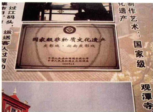
图 12 湖南衡山耇州镇打出的皮影戏入选国家级非物质文化遗产名录的宣传广告