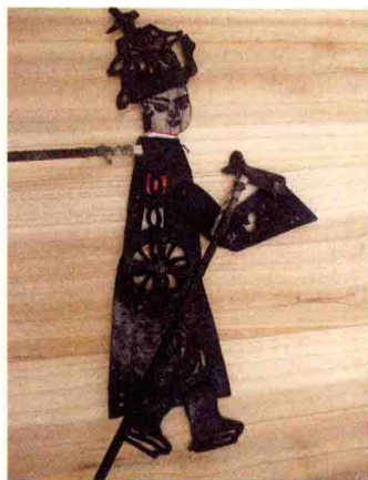
图 13 国内现在罕见的七寸影人（湖南永兴）

戏研究著作，发表了三十余篇皮影戏研究论文，但随着了解的日渐深入，却越发觉得想要真正准确、全面地介绍它，其实是件很困难的事。“明知山有虎，偏向虎山行”，这是多数学者的追求，笔者亦是如此。书稿的完成，希望能为广大读者了解中国皮影这一优秀的非物质文化遗产提供一个较为完善的读本。但由于学识、见闻所限，文中肯定有不少错误，恳请广大读者予以批评指正！