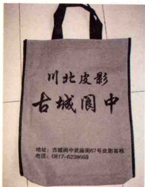
图1 四川阆中古城出售川北皮影的礼品袋

“中国皮影”一词既是“中国皮影戏”的简称、俗称，也指在皮影戏演出中艺人所操纵的道具，即用硬纸或畜皮等雕制的影人、景片，还包括一些皮影雕刻艺人开发的并不用作皮影戏表演而是用作家居装饰的工艺品。对于前两类，看过皮影戏演出的读者都应该清楚，但对第三类可能不太好