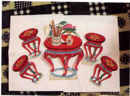
图8 甘肃环县家具皮影

客栈等景片反映了古代的居住民俗，而影人身上的衣服、头饰、发式等则反映了人们的服饰民俗等；又如图9、图10、图11三个景片则形象地反映了人类交通工具的变化。