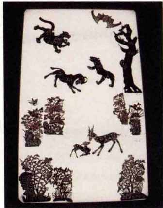
图6 中国美术学院皮影博物馆展出的鹿、虎等动物和一些花卉树木

宣纸），现在多用白布（图7）。影窗的大小，各地没有形成统一的标准，主要由演出的需要决定，因为影人尺寸的大小以及演职员人数的多寡都会影响影窗的大小。