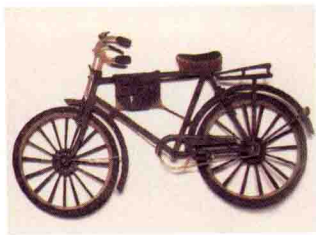
图 11 陕西华县皮影自行车