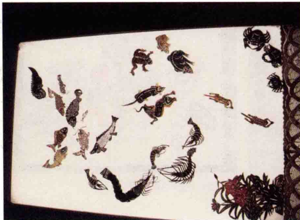
图5 中国美术学院皮影博物馆展出的鱼、虾、螃蟹等动物