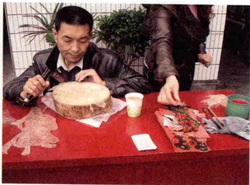
图2 陕西凤翔县文化馆内皮影艺人现场展销