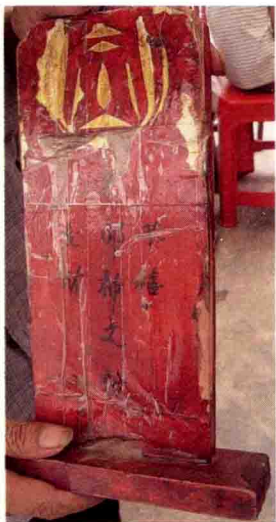
图 1-1 河南商城皮影戏艺人所供的老郎神牌位

老郎神之身份有唐玄宗李隆基、后唐庄宗李存勖、某代或唐明皇时期的一位小艺人、翼宿星君、一只白老狼、颛顼之子老童等几种说法。（《中国行业神崇拜》，中国华侨出版公司，1990年）皮影戏行供奉的老郎神是谁，艺人们的说法也是不一。