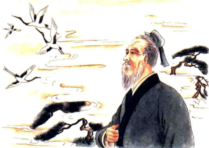
道可道，非常道；名可名，非常名。

道是中国古代哲学的重要范畴。老子是第一个把道作为一种哲学范畴提出和加以阐释、论证的思想家。道作为老子哲学的核心，贯穿其思想体系始终。关于对老子道的认识和诠释，历来众说纷纭。有的认为，道是精神性的本体，是脱离物质实体而独自存在的最高原理，主张老子的道论是客观唯心主义。有的则认为，道是宇宙处在原始状态中的混沌未分的统一体，主张老子的道论是唯物主义。一般认为道是宇宙的本原及万物运行的规律。陈鼓应在其《老子译注及评介》一书中引用杨兴顺的观点，将道的基本特点归结为：一、道是物的自然法则，它排斥一切神和“天志”。二、道永远存在，它是永存的物质世界的自然性。道在时间与空间上都是无限的。三、道是万物的本质，它通过自己的属性（德）而显现。没有万物，道就不存在。四、作为本质来说，道是世界的物质基础“气”及其变化的自然法则的统一。五、道是物质世界中不可破灭的必然性，