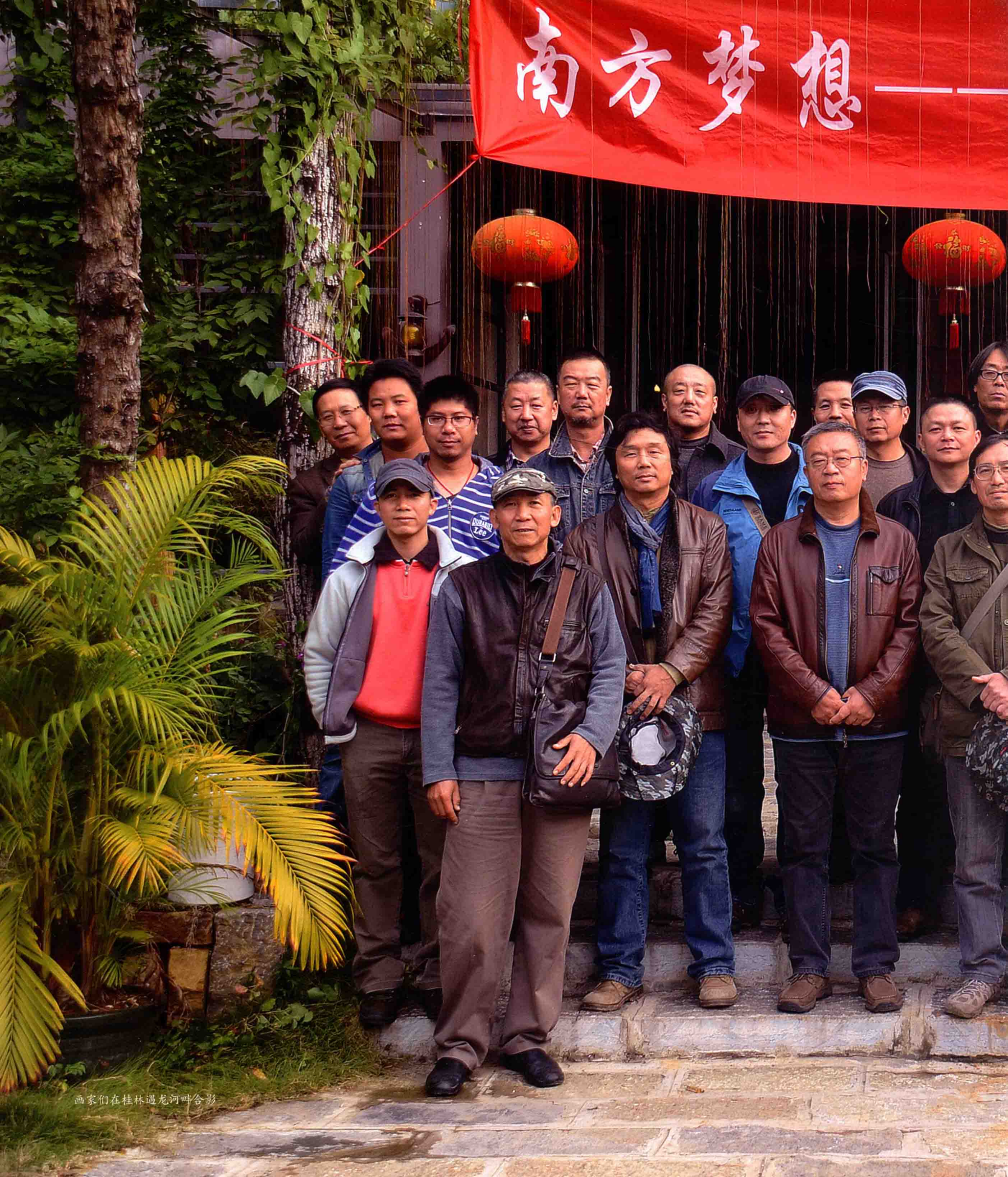
画家们在桂林遇龙河畔合影