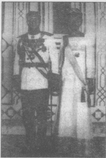
穆罕默德·礼萨巴·列维(左) 正在会见美国总统富兰克林· 罗斯福

伊朗尽管拥有世界上最富饶的石油储备,但巴列维统治时期的经济仍未达到繁荣,伊朗仍旧依赖美国的消费品和外国市场。当国王在国内大兴土木并频繁地向世人展示他庞大的军火库时,他的经济现代化计划并未使大部分伊朗人从中受益。1953年他确立了自己皇室独裁者的地位后,想尽一切办法镇压并清除他的反对派。为了监视政治活动,他建立了国内安全部队,即秘密警察组织——萨瓦克。一些国王的反对派经常受到萨瓦克的折磨、关押甚至谋害。实际上,萨瓦克制造的极端恐怖气氛使伊朗人民对任何形式的政治讨论都避而远之。