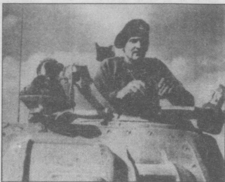
1942年11月英国陆军元帅贝纳德·劳·蒙哥马利正在检阅进军北非的军队

贝纳德曾就读于伦敦的威斯敏斯特学校。他生性倔强，于1907年入桑赫斯特皇家军事学院。1908年加入了驻守在印度西北边境的步兵团，1913年返回英国时提升为陆军中尉。第一次世界大战在前线作战时，他对备战和作战方式提出批评，战场上大量的人员伤亡和将士