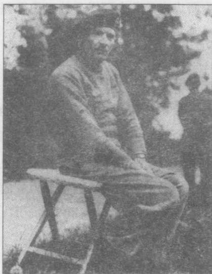
贝纳德·劳·蒙哥马利(国会图书馆)

蒙哥马利被任命在英格兰南部担任几项军职后,英国首相温斯顿·丘吉尔于1943年任命其指挥英国第八集团军赴北非作战,此时的蒙哥马利在军界以外尚不知名。他第一次有机会把自己的指挥理论付诸战争实践。蒙哥马利顶住了丘吉尔的急躁情绪,进行了充分的备战。事实证明,他的准备工作非常有效:在英国急需胜利的时候,蒙哥马利在埃及的