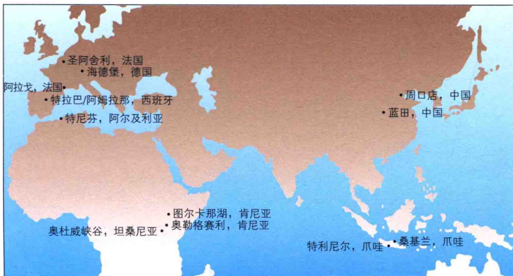
这张图标注的是早期人类在地球上分布的示意图。一般来说，学术界普遍认为人类诞生在300多万年前。

的说法是有一定道理的。如果这样的两种观点能够得到大多数的学者的公认，那么人类的年龄之说，很有可能是要大大地提前了，那么能提前多久呢？从什么时候开始提前呢？