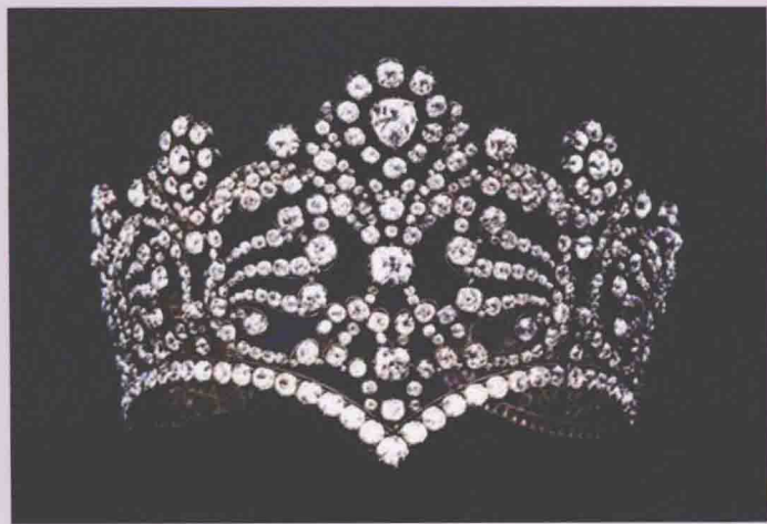
属于法国的约瑟芬皇后所有，是我在“拿破仑历史文物展”上亲眼见过的世界著名的钻石皇冠之一。

人类至今尚未发现硬度超过钻石的物质，她是当之无愧的宝石之王。在中国，钻石制品最早出现在周、秦时期，被奉为象征着强大的“金刚”。拿破仑曾为掠夺非洲的钻石，千军万马，飒爽登场。奥鲁洛夫伯爵为了得到叶卡捷琳娜女王的宠爱，把从印度佛像