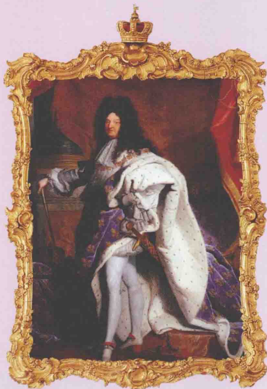
身着加冕服的路易十四，他的剑柄也镶满了宝石。