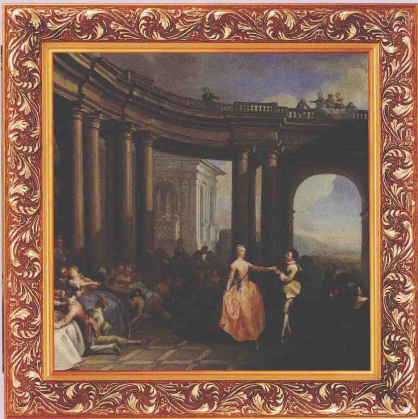
路易十四时代保存至今的油画作品，生动反映了当时法国皇宫纸醉金迷的生活场景。