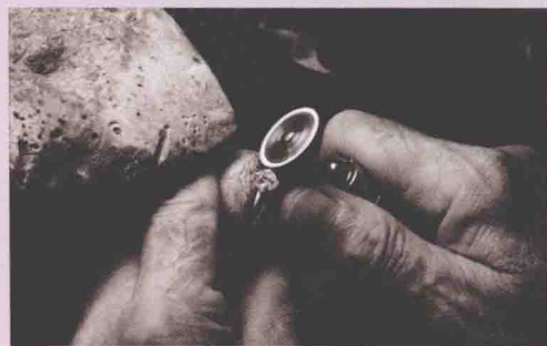
钻石工匠将美钻镶嵌于戒托之上…… 钻戒最终成型。

迄今为止，世界各国选择钻石做订婚戒指的情侣，据说占总数的70%以上。想必是那透明的光泽与新娘雪白的婚纱十分相配。无疑，更重要的原因，是钻石坚硬的质地、高昂不俗的价格，贴切地象征着爱情的宝贵与永恒。