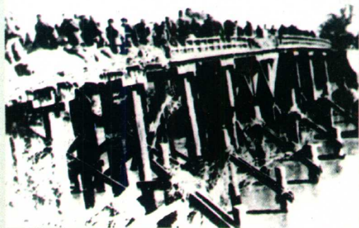
八路军、新四军在 白驹狮子口会师