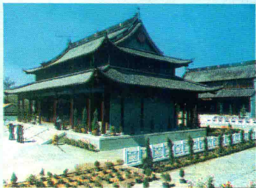
新四军军部旧址 盐城泰