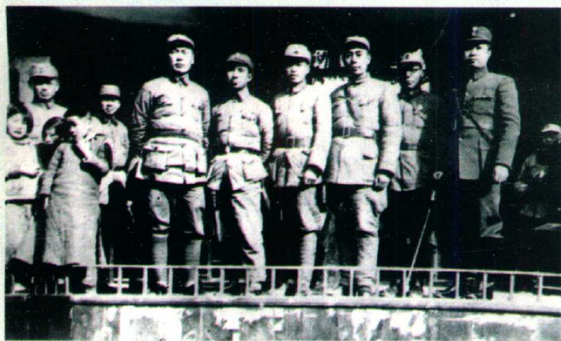
1939年3月周 恩来在皖南新四军 军部（右起：叶挺、 朱克靖、周恩来、傅 秋涛、粟裕、陈毅）