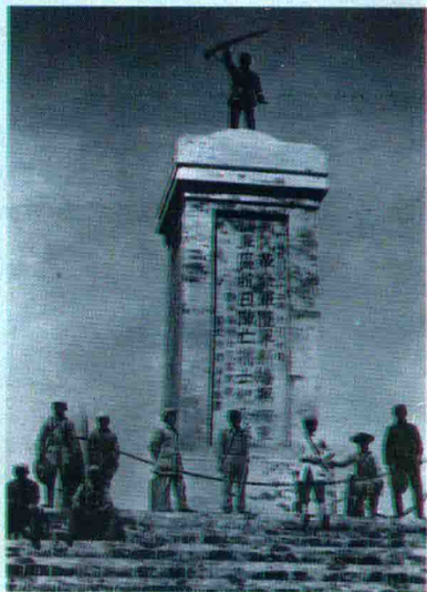
阜宁芦浦抗日纪念塔