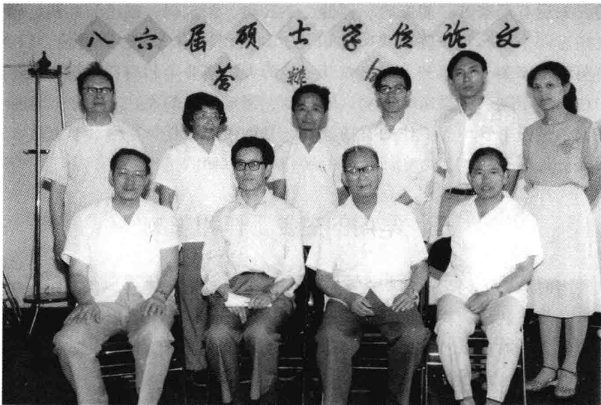
政治学系 1986 届研究生论文答辩会

在恢复或者重建我国政治学的消息传出之后，各方面积极性虽然很高，但是大多数人并不知道政治学是什么，并且急于探讨应该怎样创建社会主义国家政治学的问题。为此特由政治学所（筹备组）牵头，并与上海复旦大学和华东师范大学等单位合作，举办一系列有关政治学基本知识的讲座，费用主要由政治学所（筹备组）承担。所约请的讲课人，多是一些新中国成立以前的政治学界学者，如夏书章、周世述、潘念之教授等人。但是因为当时各方面都正着手筹建政治学系和研究机构，因而所讲的都是些入门性、概论性的东西，如什么是政治学，以及社会主义国家的政治学应该如何发展等。由于这是当时有关政治学的首创活动，所以参加听讲的人很是踊跃。杨百揆、王沪宁等都是当时的学员。这些听众当中，很多人后来都成为各地政治学有关机构的骨干。