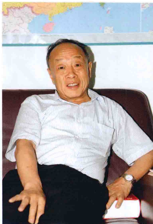
中华民 国外交 部原部 长、全 国人大 常委 会 常委、 本书编 纂指导 李肇星 先生