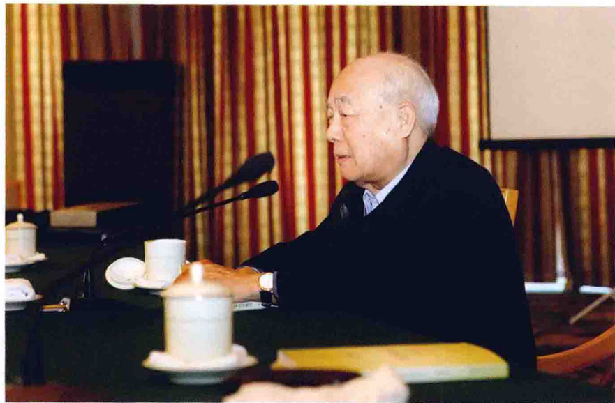
当代著名学者、本书编纂指导欧阳中石先生