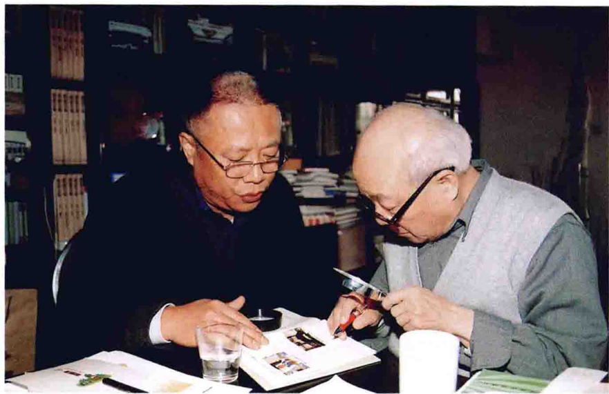
殷昭俐请欧阳中石先生审定丛书样稿