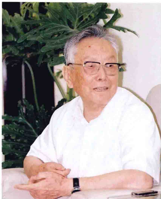
当代著名学者、本书编纂指导任继愈先生 二〇〇四年摄于国家图书馆办公室