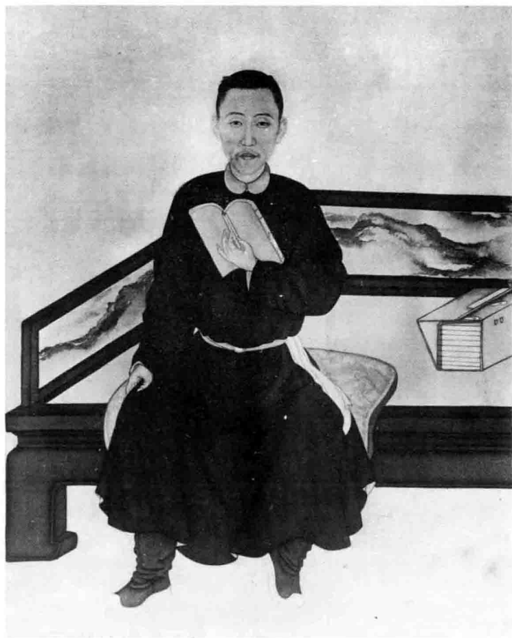
雍正青年时代画像