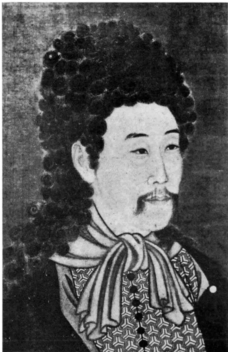
雍正披戴西洋发式画像