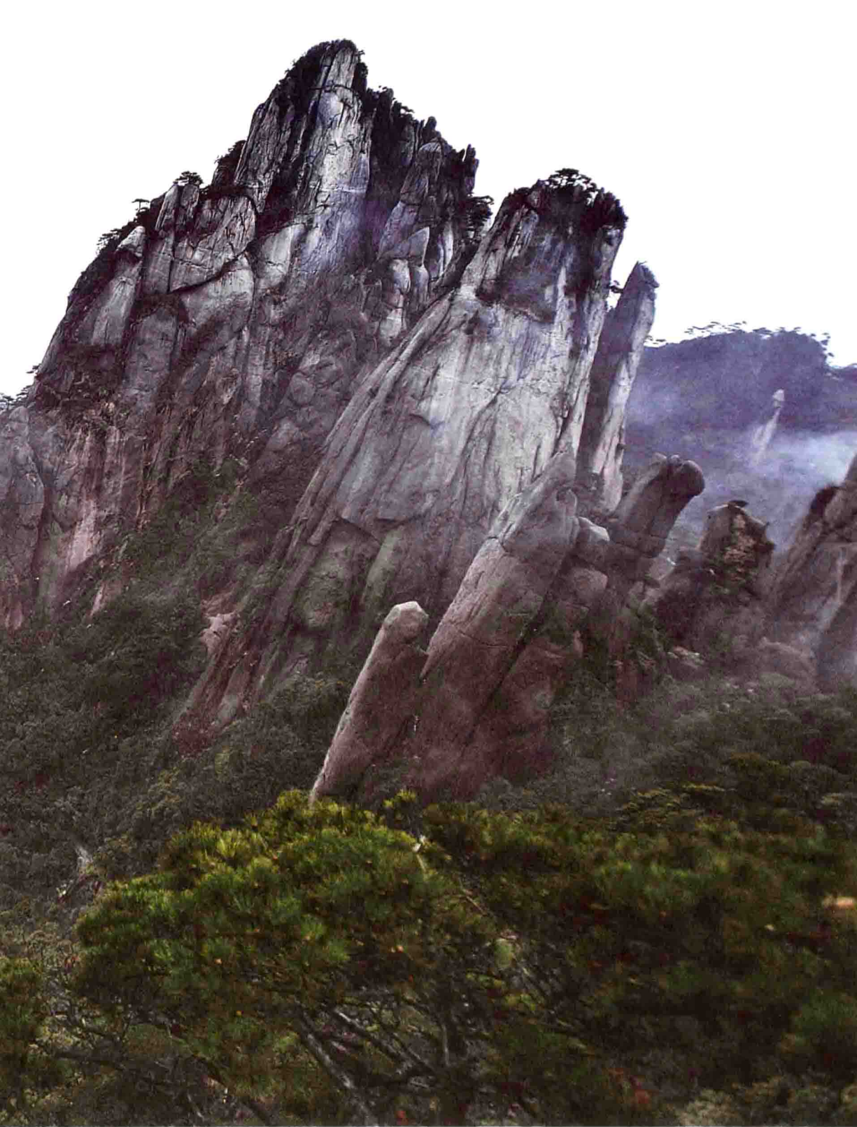
三清山登山如万笏朝天，常年云雾升腾，山上有葛仙炼丹井、炼丹台、雷神殿等道教遗迹。