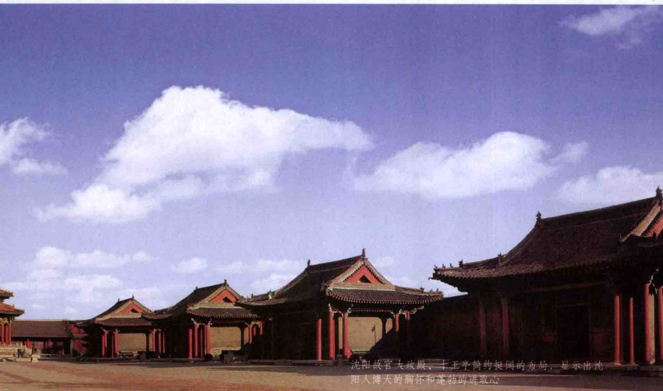
沈阳故宫大政殿、十王亭简约挺阔的布局，显示出沈阳人博大的胸怀和蓬勃的进取心

历史将从今天翻开新的一页，沈阳也将重新书写自己更新更美的文字。在这里，我们不仅要读懂沈阳的过去，还要读懂沈阳的今天与未来。