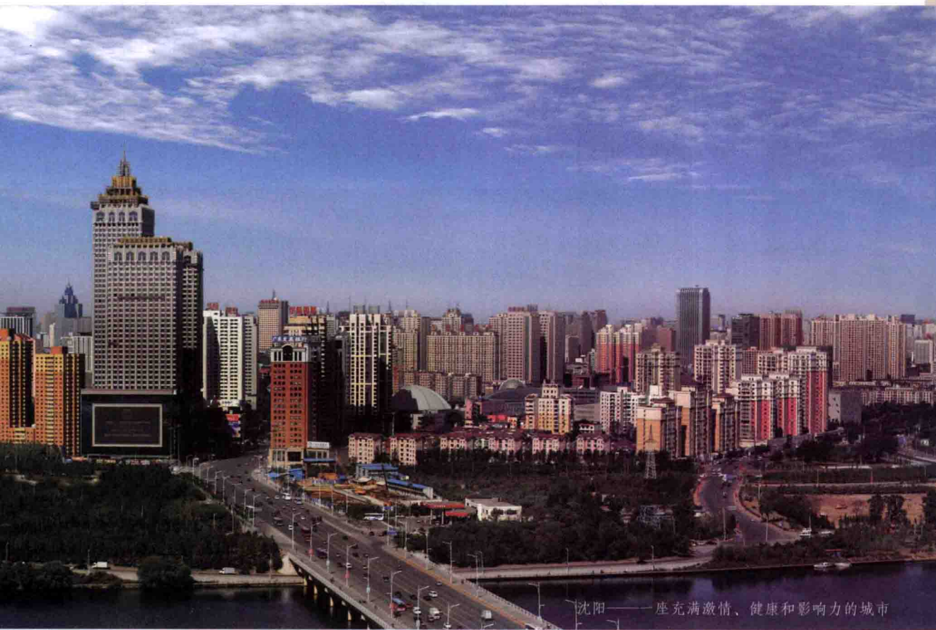
沈阳——一座充满激情、健康和影响力的城市