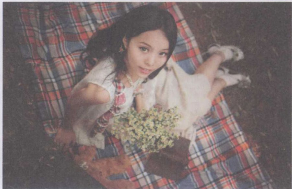
图 1-17 俯拍突出人物面部

STEP 05 平角度取景构图更平稳：平角度是与人们的视角最接近的角度，平角度取景的画面给人平稳、自然、亲切的感觉，它不易使画面变形，使人物比例还原真实。平角度区取景最容易捕捉到人物的目光，使画面产生交流感，使人物的情感表达更直接。由于平角度是人们习惯的视角，所以平角度取景容易给人平淡的感觉，视觉冲击力不大，如图 1-18 所示。