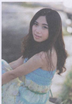
图 1-3 构图饱满图像

构图越饱满越好：室外人像拍摄时应注意避免照片构图饱满，这样无法体现室外人像的特色，使画面显得单调，如图 1-3 所示；利用室外环境可营造出温馨、清爽、寂静等多种氛围，让人物充分融入环境，使画面的情感表达更加准确，画面的意境更加悠远，如图 1-4 所示。