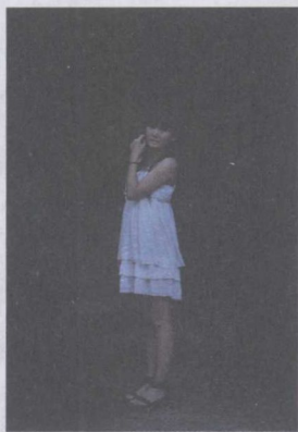
图 1-5 未使用闪光灯

在任何情况下都不使用闪光灯：虽然室外光线充足，但是闪光灯对于人像摄影的用途依然不可忽视。闪光灯不仅起着补光的作用，还在小范围内起着平衡画面的反差、协调画面色彩、补充画面立体感与空间感以及丰富画面效果等作用，闪光灯应用非常广泛，如果拍摄者善用闪光灯，那么一定能拍摄出非常精彩的人像照，如图 1-5、图 1-6 所示。