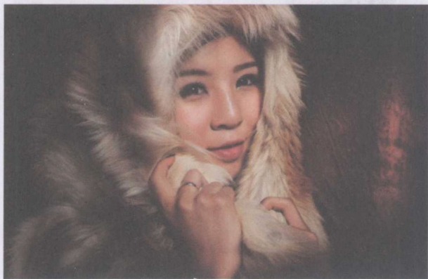
图 1-9 特写式构图

近景式构图：近景人像包括被摄者头部和胸部的形象，它以表现人物的面部相貌为主，背景环境在画面中只占极少部分，仅作为人物的陪衬。近景人像，也能使被摄者的形象给人们较强烈的印象。同时，近景人像比特写能在画面中包括一点背景，这点背景往往可以起到交待环境、美化画面的作用，如图 1-10 所示。