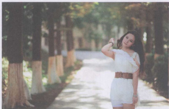
图 1-11 半身式构图

全身式构图：全身人像包括被摄者整个的身形和面貌，同时容纳相当多的环境，使人物的形象与背景环境的特点相互结合，能得到适当的表现，如图 1-12 所示。