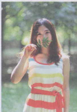
图 1-18 平角度取景构图

STEP 06 仰拍表现高挑修长的身材：仰拍从较低位置拍摄，画面容易发生变形，焦距越短，距离被摄体越近，变形越明显。利用这种变形可增加人物腿的长度，使身材显得修长、高大。同样拍摄者也可利用仰拍角增加画面的新鲜感，使画面呈现出独特的效果，展现出人物的端庄、高贵的感觉，如图 1-19 所示。