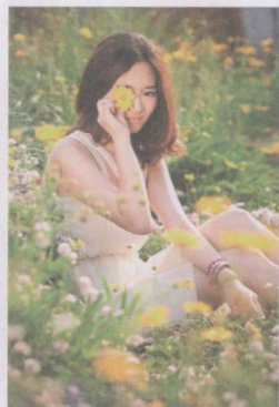
图 1-2 下午四点以后拍摄图像