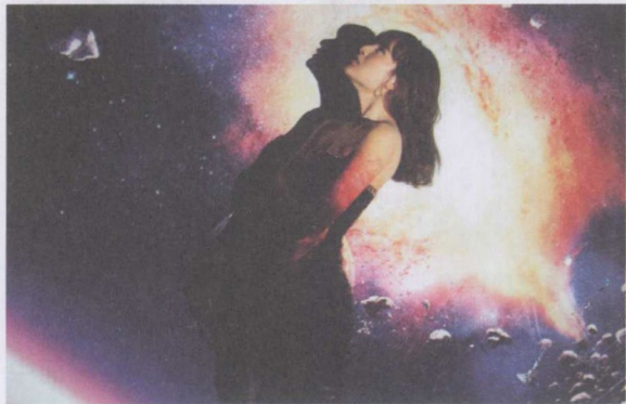
图 1-16 侧面角度拍摄

STEP 04 俯拍突出人物面部：俯拍即从较高位置拍摄，可用于展现人物富有亲和力的一面，常用于表现年轻的女性。俯拍时人物的面部距离相机最近，处于最显眼的位置，能突出人物面部。当使用短焦距俯拍时人物的头部会变大、腿部会变小，相机距离人物越近变形越厉害，拍摄者应注意把握好变形的度，如图 1-17 所示。