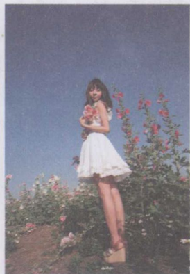
图 1-19 仰拍人物