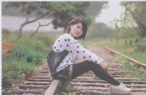
图 1-7 正确测光模式

仅选择评价测光模式：拍摄者应根据室外光线的分布情况选择测光模式，这样才可使画面曝光准确并保持丰富的层次，如图 1-7 所示；评价测光模式适合于光线分布均匀的环境中拍摄，当在光线分布不均匀的环境中拍摄时，使用评价测光模式将使画面明暗差异缩小、影调变得平淡，如图 1-8 所示。