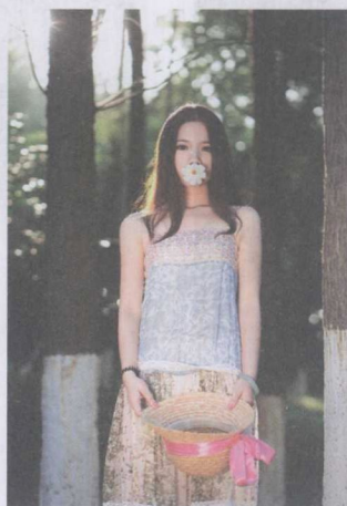
图 1-14 正面角度拍摄