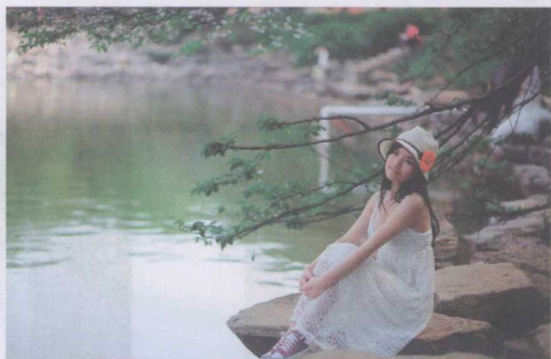
图 1-12 全身式构图