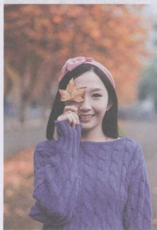
图 1-13 正面角度拍摄

STEP02 七分面角度拍摄：七分面人像，指被摄者正面部略微向一侧转动，但从相机的方向仍能看到被摄者脸部正面的绝大部分。如果以被摄者面部正面和侧面所占的比例划分，七分面人像应是脸部的正面占大部分，而侧面只占小部分，这种拍摄方法使照片显得轻松活泼，同时能更好地使照片显得轻松，同时能更好地使照片呈现出立体感，很适合脸部轮廓不够完美的人物，如图 1-15 所示。