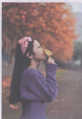
图 1-10 近景式构图

半身式构图：半身人像往往从被摄者的头部到腰部，或腰部以下膝盖以上，除了以脸部面貌为主要表现对象以外，还常常包括手的动作。半身人像比近景或特写人像画面中有了更多的空间，因而可以表现更多的背景环境，能够使构图富有更多的变化。同时，画面里由于包括了被摄者的手部，就可以借助手部的动作帮助展现被摄者的内心状态，如图 1-11 所示。