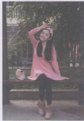
图 1-8 评价测光模式