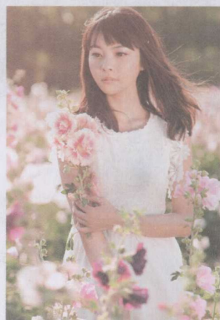
图 1-15 七分面角度拍摄

STEP03 侧面角度拍摄：侧面人像是指被摄者面向照相机侧方，与相机镜头光轴构成大约 90 度的角度拍摄的人像，从这个方向拍摄，其造型特点在于着重表现被摄者侧面的形象，尤其是从侧面