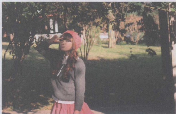
图 1-6 使用闪光灯