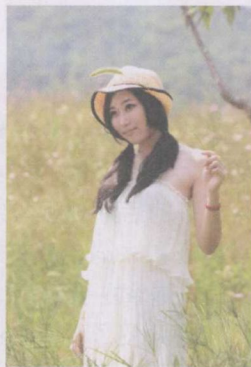
图 1-1 正午时段拍摄

光线越强越好：充足的光照有利于拍摄者灵活控制画面效果，使拍摄者不必为确保准确而只能设置大光圈、慢速快门或使用闪光灯补光。但光线并非越强越好，室外最强的光线出现在正午，此时画面会出现过大的反差，拍摄者难以兼顾画面的亮暗两级，如图 1-1 所示。室外人像拍摄的最佳时间是上午八点至十一点以及下午四点以后，此时光线照射高度、强度、色温都比较适宜，如图 1-2 所示。