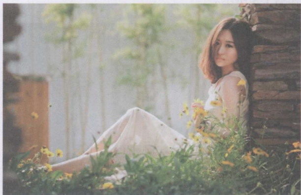
图 1-4 三分法构图