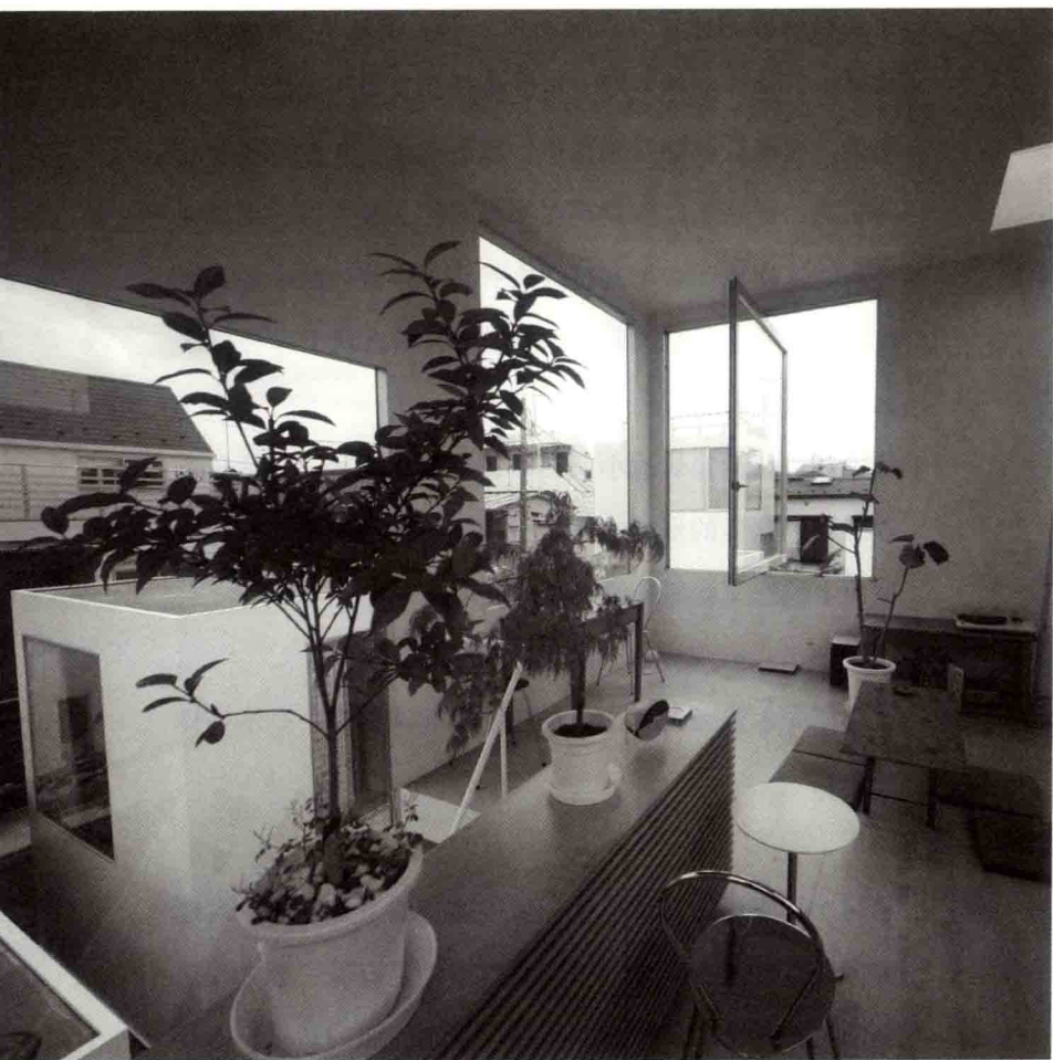
西泽立卫建筑设计事务所“森山邸”2005年。A栋3F