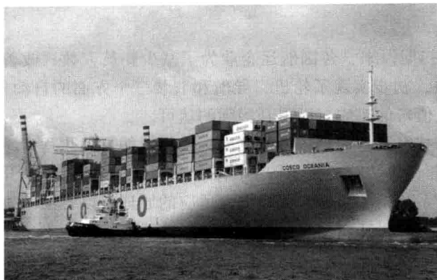
图 1-1 中远大洋洲号 10200TEU 集装箱船

班轮公司纷纷定造 10 000 TEU 左右的超大型船舶。中国远洋运输集团公司（中远集团）旗下的中远大洋洲号（COSCO OCEANIA）是首条由我国自主制造的 10 000 TEU 集装箱船。船体总长 349.5 m，宽 45.6 m，可装载 10 020 TEU（见图 1-1）。