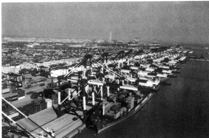
图 1-2 青岛港集装箱码头