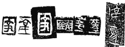
图0.2 郑州市区出土的战国、秦汉时期“亳”“亳丘”“亳聚”陶文

都邑作为王都伴随着国家政权的产生而产生，是国家政治、经济和文化的中心，也是古代聚落发展的最高形态。众所周知，在任何历史时期，正确地选建都邑位置、特别是新建王朝初期的都邑位置，关系着政权的稳定，国家的安危，因而是最高统治集团必须慎重处理的重大问题。那么商人为什么要在现今的郑州地区选建王都亳邑？我们认为古人选建都邑必须优先考虑两个因素，即社会环境因素和自然环境因素，商人对此也不能例外。所谓“社会环境因素”，就是都邑特别是新建王朝初期的都邑，必须选建在本部族兴起、发展并形成强大势力范围的中心地区，因为这里经过长期经营，有着广泛的群众基础，从而能够成为维护国家政权稳定的坚强后盾。《吕氏春秋·慎势》云：“汤其无鄆，武其无岐，贤虽十全，不能成功。”高诱注：“鄆、岐，汤、武之本国，假令无之，贤虽十倍，不能以成功业。”又云：“鄆，汤所居也；岐，武王所居也。”（《吕氏春秋·高义》注）意思是说鄆、岐这两个地区是商族和周族长期聚居、兴起、最早建都于此的中心地区，如果没有这两个地方人力、物力的全力支持，商王成汤和西周武王二人即使十分贤明，也不可能完成在此建立商、周王朝的大计。“岐”即岐山，在今陕西省岐山县境，《诗经·大雅·绵》云：“古公覃父，来朝走马，率西水浒，至于岐下。”《史记·周本纪》：古公覃父率其族众“踰梁山，止于岐下”。《集解》：“徐广曰：（岐）‘山在扶风美阳西北，其南有周原’。骊按皇甫谧云：‘邑于周地，故始改国曰周。’”《孟子·离娄》下：“文王生于岐周，卒于畢郢。”赵岐注：岐周，“岐山下周之旧邑”。《诗经·鲁颂·閟宫》又云：“后稷之孙，实惟太王，居岐之阳，实始翦商。至于文、武，纘大（太）王之绪，……敦商之旅，克咸厥功。”可见周族正是在这里兴起发展，并且建立起方国政权，为推翻商王朝、建立周王朝奠定了坚实的基础。后来文王、武王虽然自此沿渭水东进迁都于丰、镐，但距岐周不远，即所谓“居岐之阳，在渭之将”（《诗经·大雅·皇矣》），仍属周族势力范围的中心区域，因此到了战国时期，人们依然认为如果“武其无岐”，即离开“岐周”族众的支持，武王是不可能有所作为的。“鄆”是商王朝建立前后商族势力范围，《吕氏春秋·慎大览》：夏民“亲鄆如夏”，高诱注：“‘鄆’读如‘衣’，今兖州人谓‘殷’氏皆曰‘衣’，言桀民亲殷