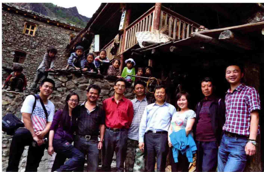
深入俄亚大村了解纳西族音乐文化