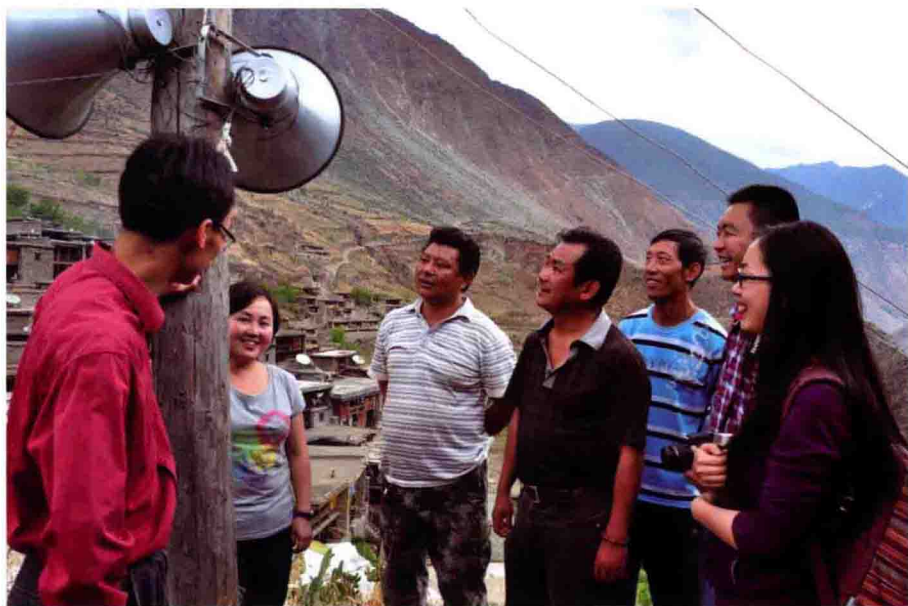
纳西族俄亚大村最高处的扩音喇叭，承载着向村民传播音乐文化的光荣使命