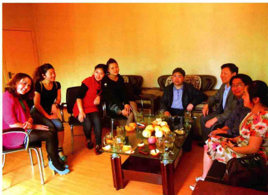
与雷波县艺术团小演员畅谈彝族音乐文化