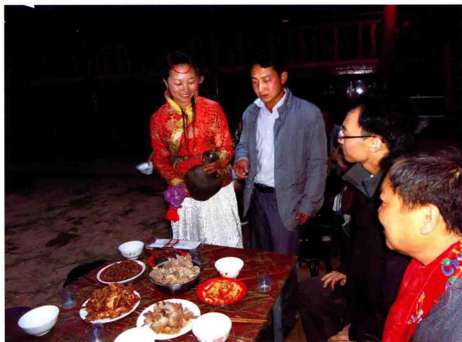
遍地的松树枝，插上鲜花的咣当酒，热情的主人以最隆重的礼节接待我们