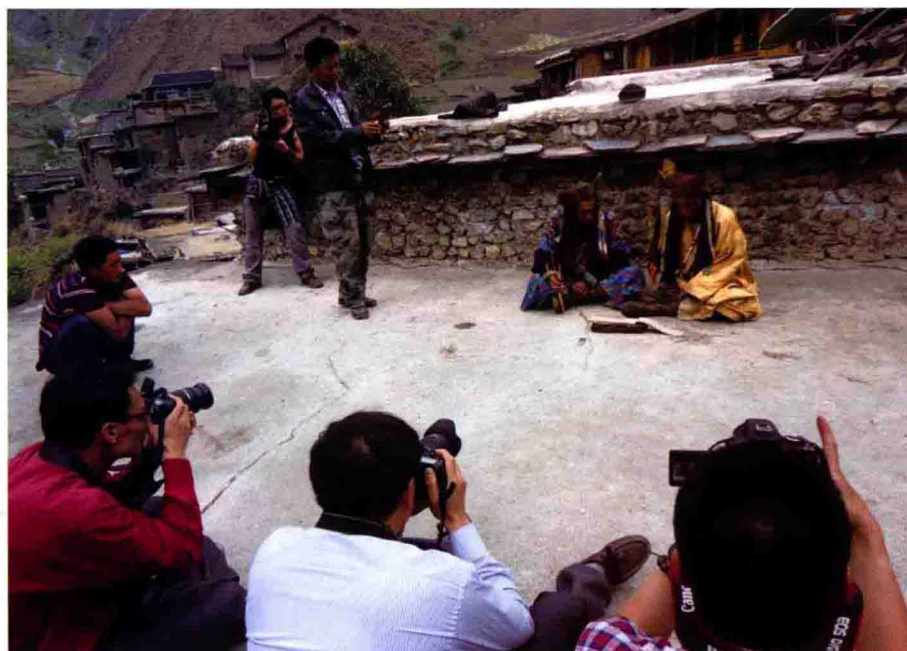
录制东巴诵经场景