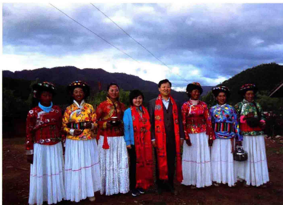
木里县屋脚蒙古族乡利加咀村姑娘们以美酒和歌声欢迎我们