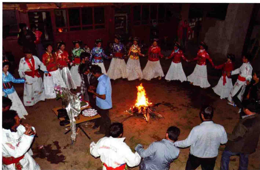
晚上激情四溢的篝火狂欢