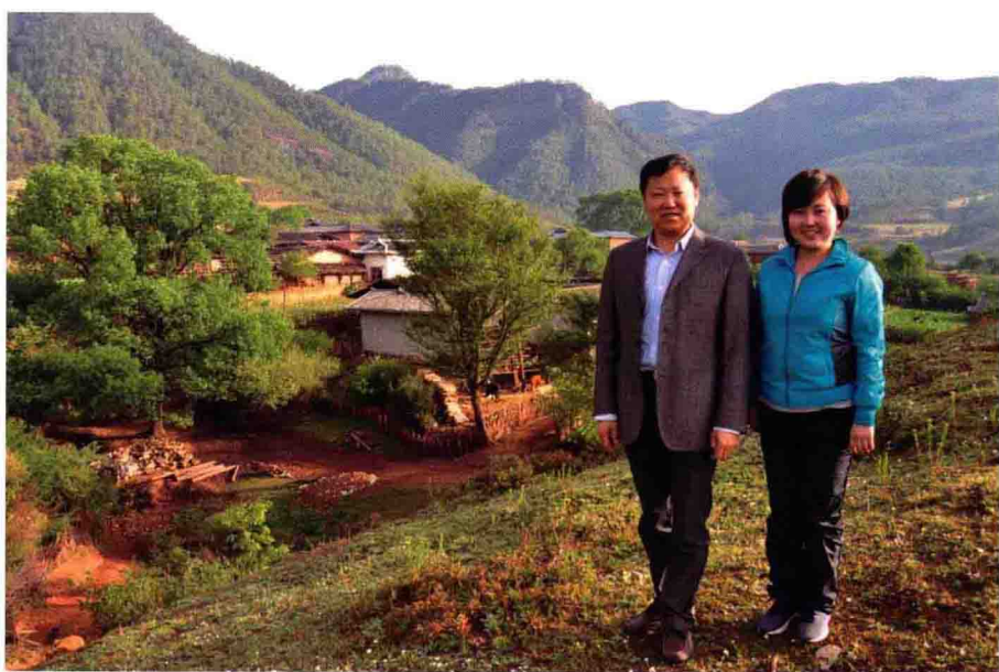
清晨宁静的利加咀村