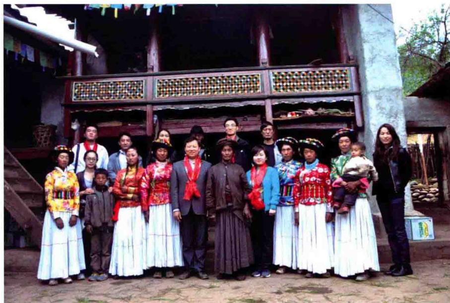
利加咀村的一家人，我们从中了解到家族音乐文化的传承