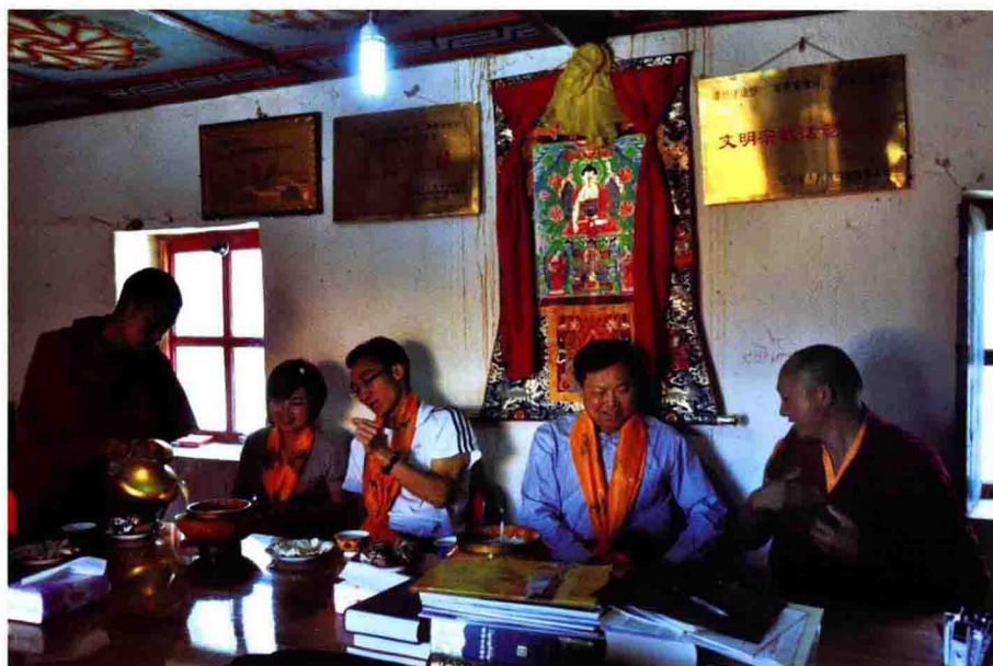
与木里大寺高僧座谈宗教音乐文化