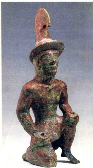
新源县71团海塘遗址出土的具有塞人特征的战国时期武士铜俑

月氏人 战国时期活动于包括河西走廊在内的甘肃西部到塔里木盆地的广大地区。秦汉之际最为强盛，常常轻视匈奴。匈奴冒顿单于为太子时，就曾作为人质扣押在月氏。月氏还攻击过乌孙，杀其王难兜靡，占据祁连山北麓。汉文帝前元三年（公元前177