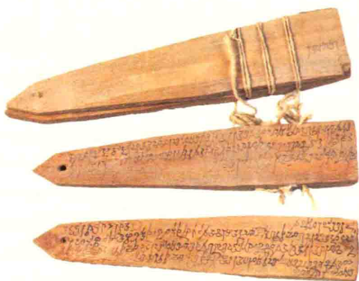
民丰县尼雅遗址出土汉—晋时期的佉卢文木简

多中亚粟特商人在塔里木盆地和河西走廊建立了若干类似村落的据点,从而使西域的人种和民族构成产生了变化。从3~5世纪活跃在鄯善的古代民族成分的构成,可以看到塔里木盆地西域古代民族成分的缩影。当时,鄯善位于塔里木盆地东缘。