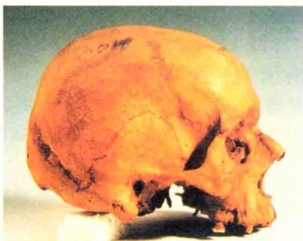
山普拉出土的男性头骨