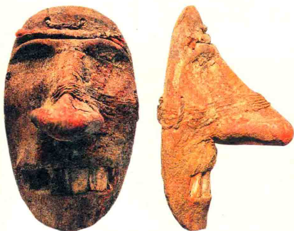
孔雀河小 河墓地出土的 木雕人面

从1983年起,考古工作者对和静县察吾呼沟古墓群进行了发掘,并在3号墓地采集了11具人类头骨。根据测定分析,该墓地距今1900年左右,即相当于东汉时期。这些头骨欧罗巴人种性质减