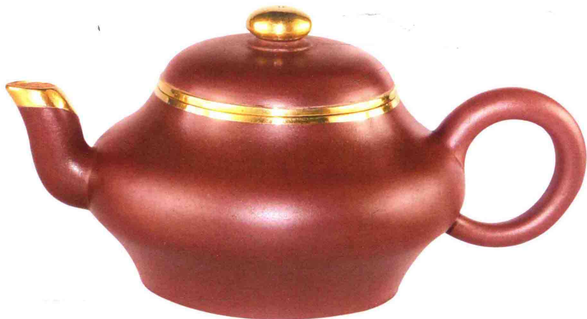
神灯壶 清代 170毫米×100毫米