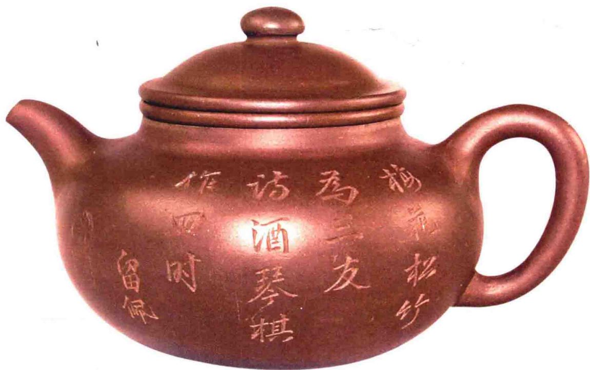
莲子壺 清代 100毫米×90毫米