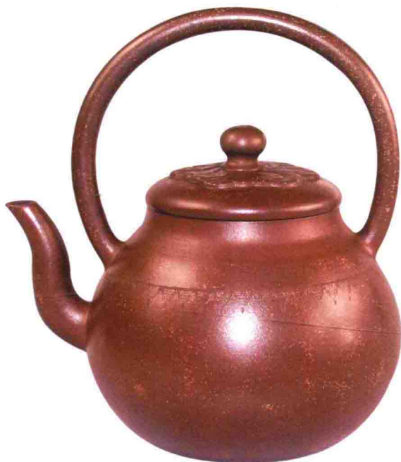
高升提梁壶 明代 160毫米×130毫米