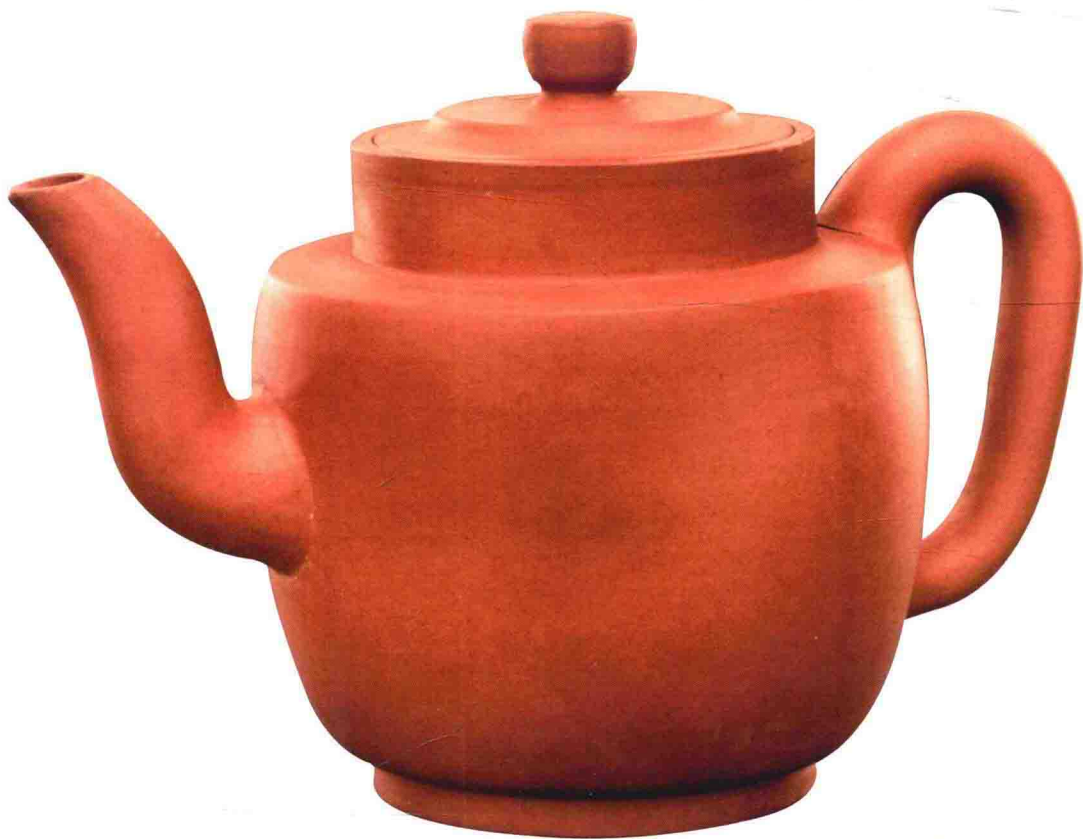
紫泥大持壶 明晚期 高263毫米