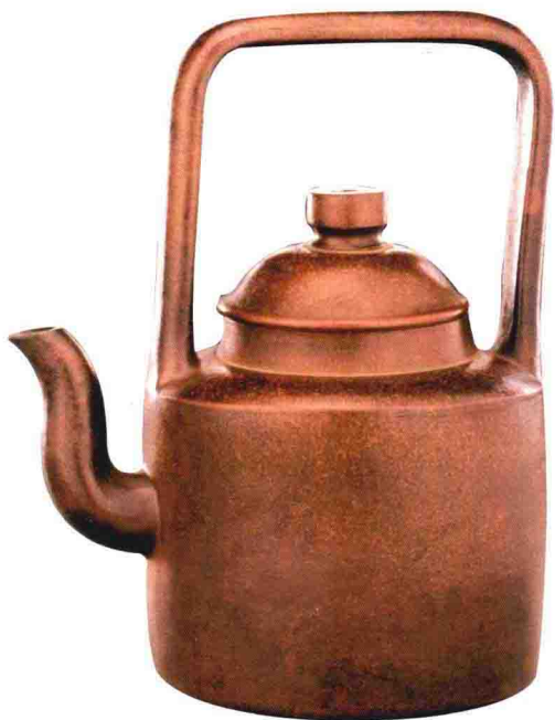
紫泥提梁圆筒形壶 明晚期 高250毫米