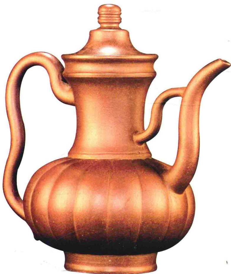
紫泥锦囊执壶 清早期