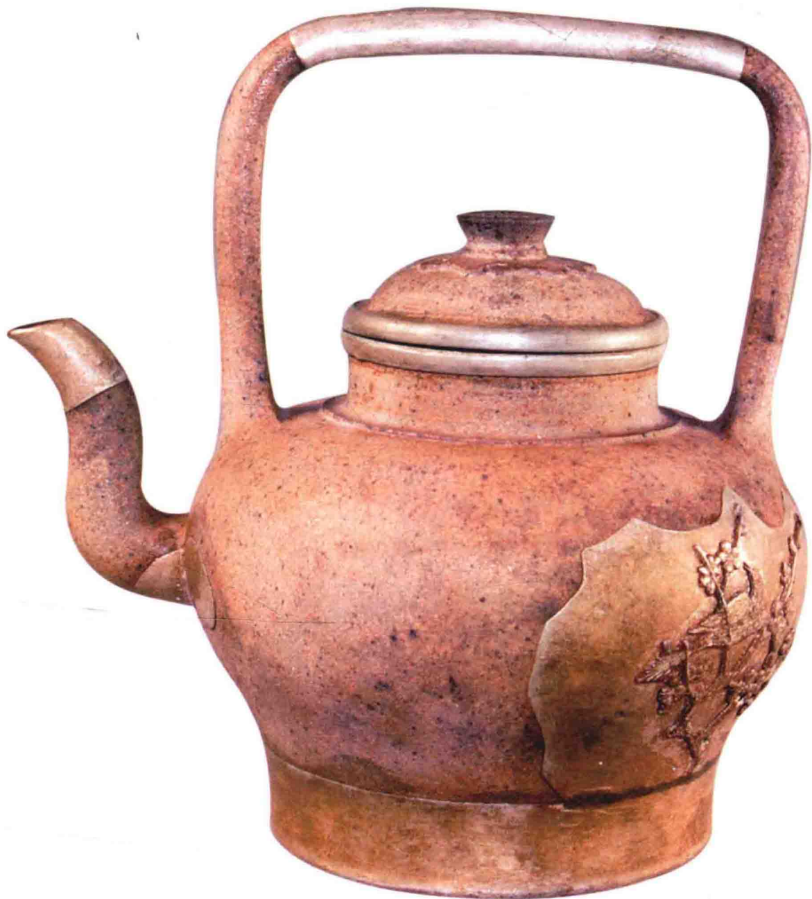
包银提梁壶 明代 190毫米×180毫米

宜兴陶土分布于南郊丘陵地带，种类繁多。当地一般把陶土分为白泥（灰白色粉砂质铝土质黏土）、甲泥（紫色为主的杂色粉砂质黏土）、嫩泥（土黄、灰白色为主的杂色黏土）三大类。在浙北长兴的丁甲桥、顾渚、新槐一带也有这三种泥，系同一矿脉，只是有山阳、山阴之分。