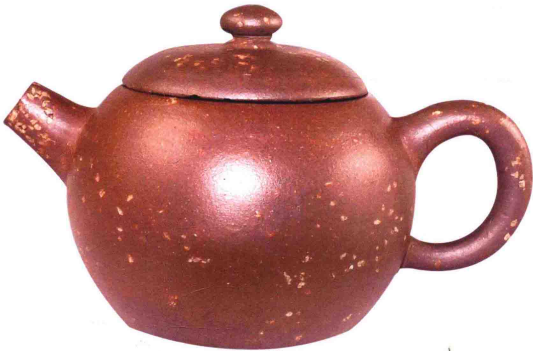
巨轮壶 明代 100毫米×60毫米

认质地最好的茶具。自宋代开始，紫砂陶随着饮茶方法的改变，登上了茶具的领头地位，至明代大盛，清代又进一步发展。目前，紫砂茶具的艺术价值远远超过了它的实用价值。紫砂壶是从煎煮茶饼的大砂罐演化而成，其色泽由土黄发展到以紫色为主，形状也从大到小。它的美，在于壶泥、壶色、壶形、壶款、壶章、题铭、绘画、书法、雕塑、篆刻等方面。