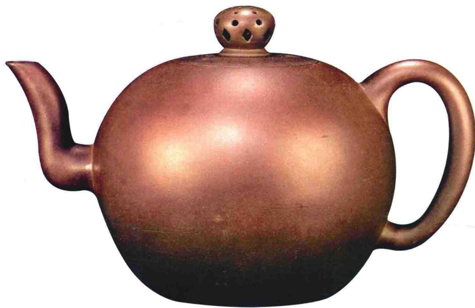
紫砂镂空纽圆形大壶 清早期