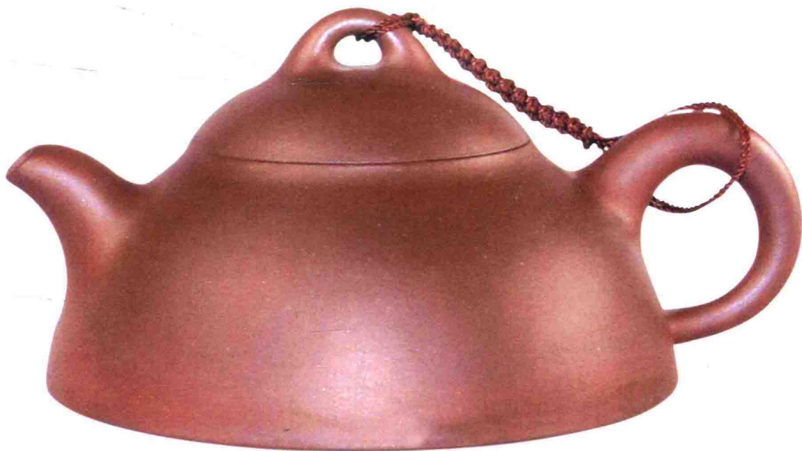
秦权壶 清代 140毫米×120毫米

第五，紫砂壶传热慢，提携端倾不易烫手； 第六，壶用得越久，壶身反而越光泽、 圆润；