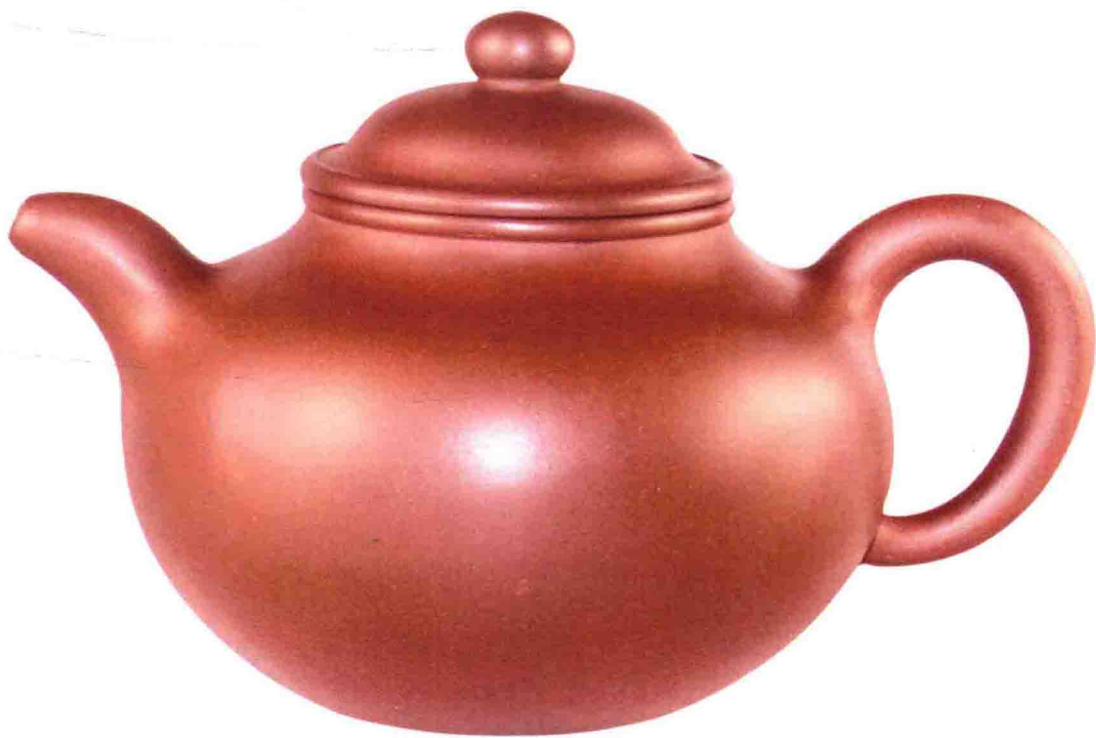
掇球壺 清代 108毫米×100毫米